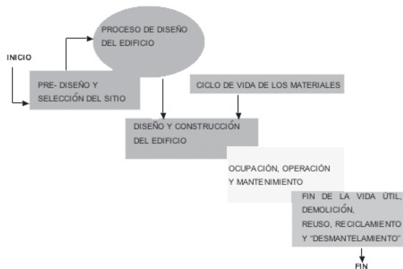
Figura 1. Ciclo de vida de los edificios y su relación con el proceso de diseño del edificio.

La Comisión Mundial para el Medio Ambiente y el Desarrollo, de la Organización de las Naciones Unidas (ONU), ha dado la siguiente definición para “sustentabilidad”:... satisfacer las necesidades del presente sin comprometer las necesidades de las futuras generaciones , (Oxford University,