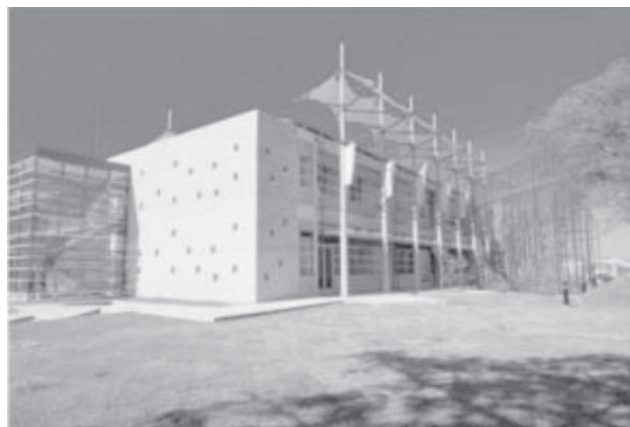
Figura 3. Diseño sustentable en edificios: Diseño bio-climático como parte del Diseño sustentable; específicamente de cubiertas suspendidas, lo cual sirve para el sombreado interno y externo de los espacios arquitectónicos..

La figura 4 muestra entonces los principios del diseño sustentable en arquitectura y las principales estra-