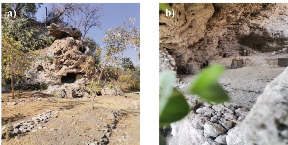
Figura 3. Secciones de las cuevas con cuidados incipientes; a) áreas verdes, b) troncos como asientos y recipientes para colocar la basura.

Por ello, la sensibilización sobre la importancia de las cuevas milenarias puede tener un impacto profundo en el interés y la participación de una comunidad en la conservación de estos espacios únicos. Al educar a los miembros de la comunidad sobre el valor histórico, cultural y ecológico de las cuevas, se puede despertar un sentido de conexión y responsabilidad hacia su entorno natural (Echeverría, 2021).