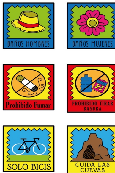
Figura 1. Propuesta vectorizadas de las señales. Por Ramírez-Pacheco D.M

Este punto es dado que, las cuevas milenarias es un lugar con el piso resbaloso, parte de peligro y precaución, es indispensable la aplicación de señales que evitarán algún accidente para los turistas; baños, caminar con cuidado, lugares prohibidos, no fumar, advertencia, solo bicis, no tirar basura, cuidar las áreas verdes, por mencionar algunos, a continuación, se presentan unas propuesta a color.