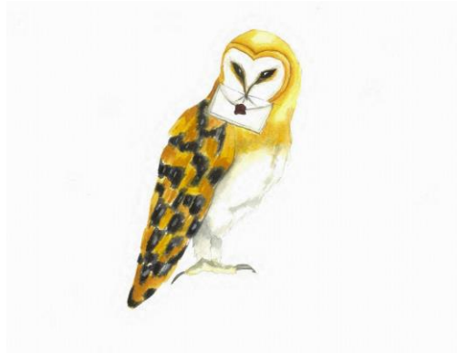
Figura2. Tyto Novaehollandiae. Paola Varela.

La lechuza de campanario. Esta es un ave rapaz que pertenece a la familia de Tytonidae . Especie de mediano a gran tamaño que mide de treinta y tres a treinta y cinco centímetros de longitud, con un peso promedio de trescientos cincuenta gramos. El color de su cuerpo es bastante claro y sus largas plumas tienen manchas grises. También, no hay diferencias a simple vista entre las hembras y los machos. Su primera fuente de alimentos son los roedores que suele cazarlos por las noches, mientras que, por el día, decide descansar entre árboles frondosos para mantenerse a salvo. Suelen vivir dos años aproximadamente, por lo cual, las crías crecen con rapidez y por esta misma razón no se le considera un