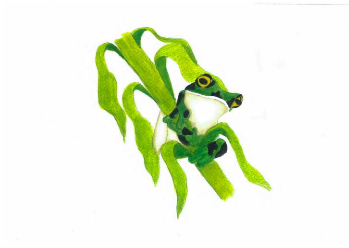
Figura 4. Lithobates neovolcanicus . Paola Varela.

Y la lluvia comenzó a seguir al sapo Cachetón. Pero como era pequeño, la lluvia le perdió de vista. ¡Menos mal que escuchó el canto del sapo Patón en el primer cerro! Allí que fue la lluvia. Y cuando pasó el cerro, escuchó el canto del sapo Enano, y la lluvia no tuvo problemas en llegar hasta el segundo cerro. Por último, la lluvia escuchó con claridad el canto del sapo Bocón, en el cerro en donde estaba el maizal. Y allí fue la lluvia, y se quedó unos cuantos días. Los hombres estaban muy agradecidos a los sapos. Y así es cómo desde entonces los sapos continúan cantando en cuanto llueve.”