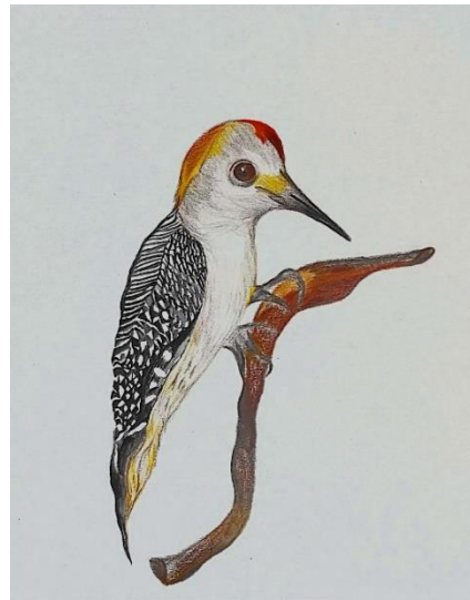
Figura 1. Melanerpes aurifrons . Frida Tejada.

El carpintero cheje es un ave de color beige, con en la cabeza y dorso color naranja, rojo o combinación de estos colores con plumaje blanco y negro, pico negro teniendo color en el inicio del pico y patas café claro. Es una especie que se caracteriza por trepar, tamborilear y perforar las ramas y arbustos para recolectar alimento u hogar. Su tamaño varía entre los veinte o sesenta centímetros, los cuales, dependiendo del tamaño y desarrollo de su pico, poseen lenguas pequeñas y puntiagudas. Un dato curioso es que esta especie puede picotear doce mil veces al día. En su simbolismo se asocia a la lluvia y el agua, elementos de prosperidad en las comunidades, cambio, comunicación y conexión a lo material. Ubicado en el Cerro del Cubilete, Silao, Guanajuato, México.