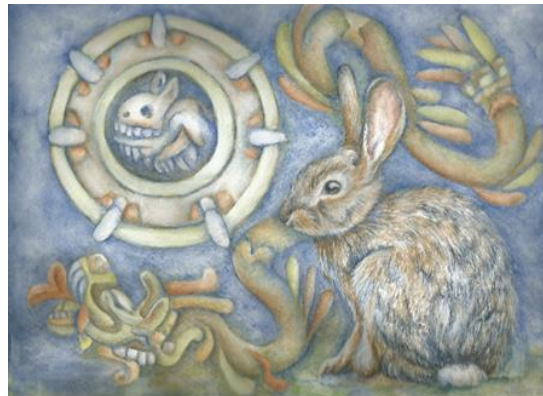
Figura 3. Sylvilagus audubonii . Paola Uribe.

El conejo del desierto ( Sylvilagus audubonii ) o conejo matorralero es una especie de mamífero lagomorfo de la familia Leporidae. El género Sylvilagus , al que pertenece este conejo, incluye a los conejos de cola de algodón. Es más pequeño que otras especies. Vive en los matorrales áridos. Se puede encontrar en el suroeste de Norteamérica, desde el norte de Montana, en Estados Unidos, hasta el centro de México, y al oeste, cerca de la costa del Pacífico. Se le asocia a zonas secas semidesérticas del suroeste americano, encontrándose a alturas de hasta 2000 m s. n. m.. También se puede encontrar en terrenos menos áridos, como el bosque de enebros.