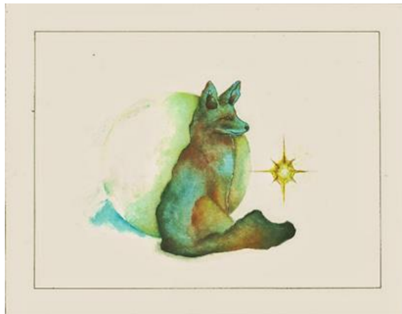
Figura 3. Canis latrans . Jesús Cervantes.

El coyote es una especie de mamífero carnívoro de la familia de los perros, lobos, chacales y zorros (Canidae). Su nombre científico significa “perro aullador”. Mide menos de 60 cm de altura y entre 74-94 cm de longitud (sin la cola). Pesa entre 8 a 16 kg. Su color va de gris a canela, a veces con tintes rojizos. Orejas y hocico parecen largos en comparación con su cabeza. Puede ser identificado por su cola espesa y ancha, que a menudo llevada cerca del suelo. Su esbeltez le distingue de su pariente mayor, el lobo gris. El coyote es muy flaco y puede parecer desnutrido a primera vista aun gozando de buena salud. Es una especie sumamente adaptable tanto en hábitat como en hábitos alimenticios 4 En la cultura purépecha el coyote simboliza el vínculo entre el inframundo y el mundo de los vivos, también como un animal que se puede comunicar con las deidades del cielo 5 .