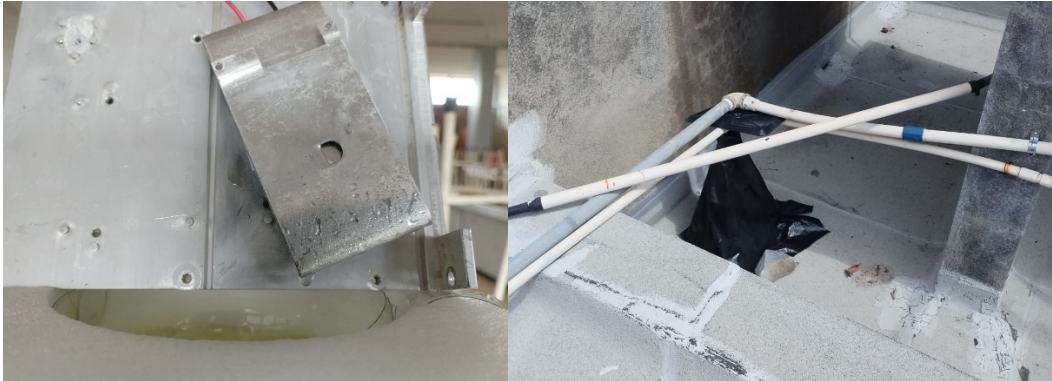
Figura 2. Condensación en sistema de captación activo (izquierda) y montaje del sistema de captación pasivo (derecha).

Con respecto al sistema pasivo, para su construcción se utilizó sólo el siguiente material reciclado: una bolsa negra de empaque, palillos de madera (45 cm largo), cinta adhesiva y una tapa de garrafón de 19 litros. Con los palillos se construyó una estructura con forma de pirámide rectangular. En la base de la pirámide se colocó una bandeja de metal. En la cima de la estructura se dispuso una estructura circular hueca que se hizo con la tapa de un garrafón de agua. El exterior de la estructura se cubrió con bolsa de empaque negro y se llevó el sistema a la parte más alta de un edificio.