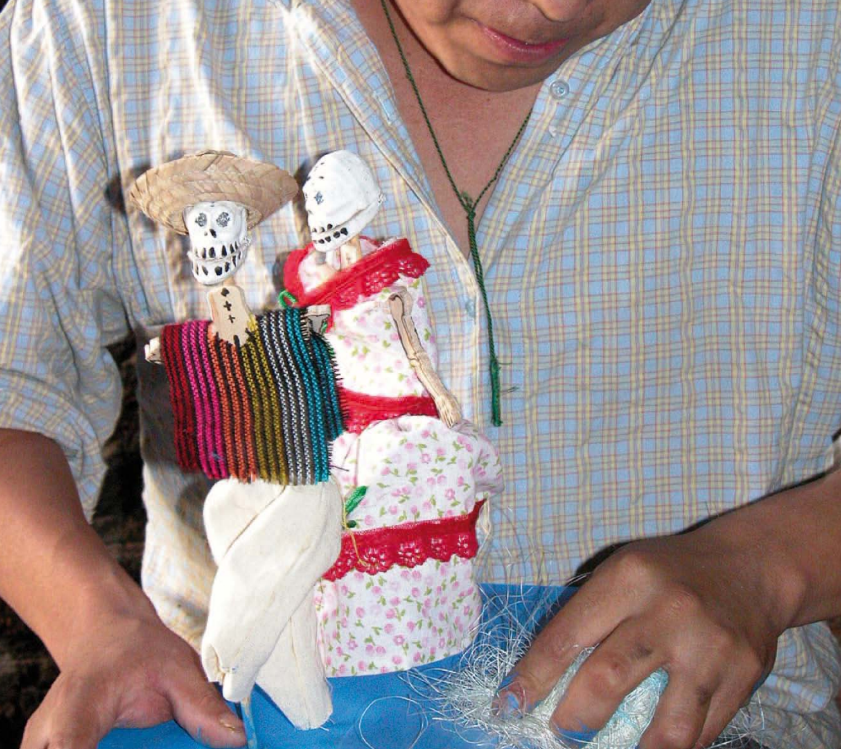
Caja de movimiento con bailadores.