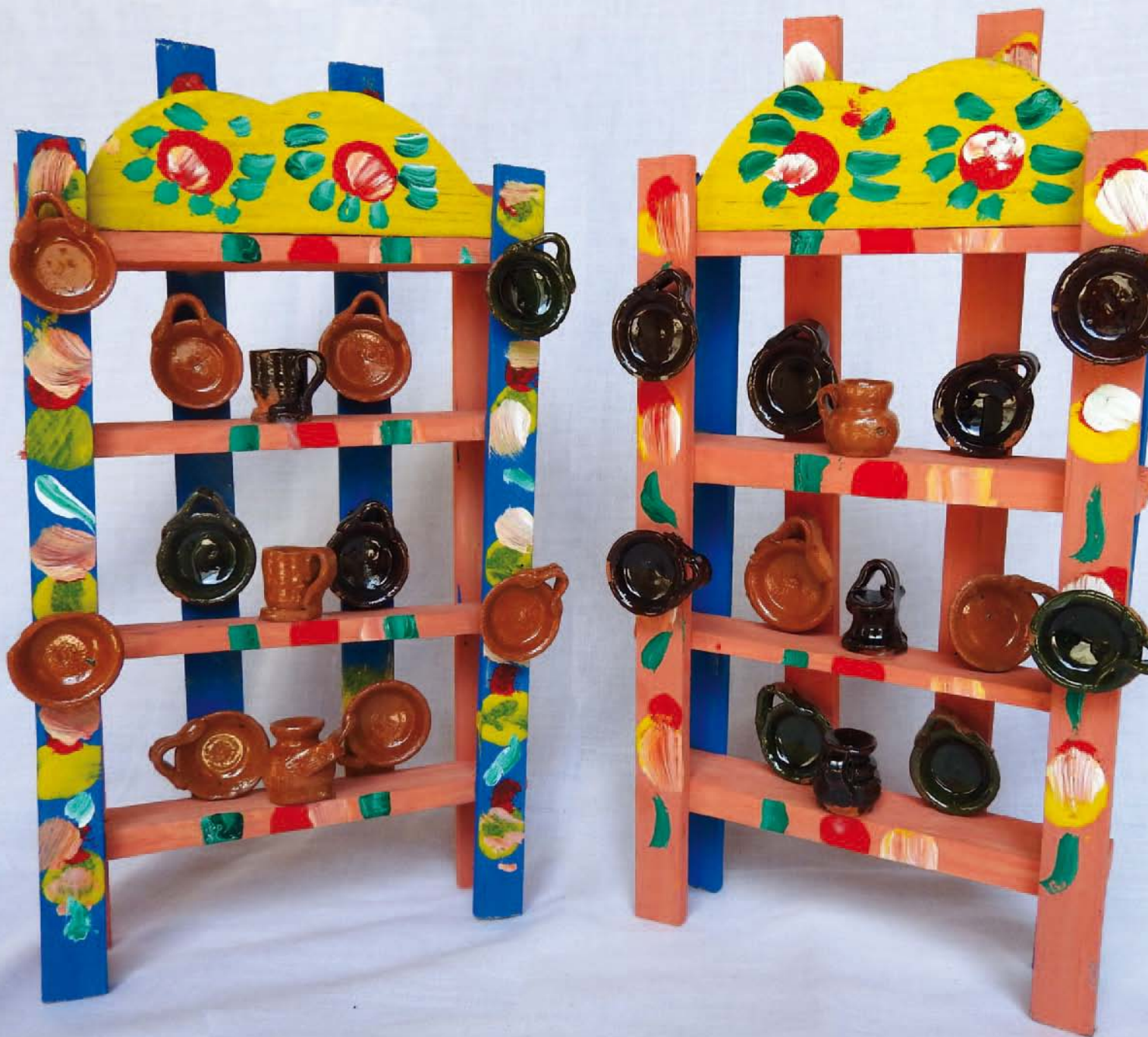
Trasteros para niñas, reproducciones de los que se usaban años atrás en casa de Sshinda.