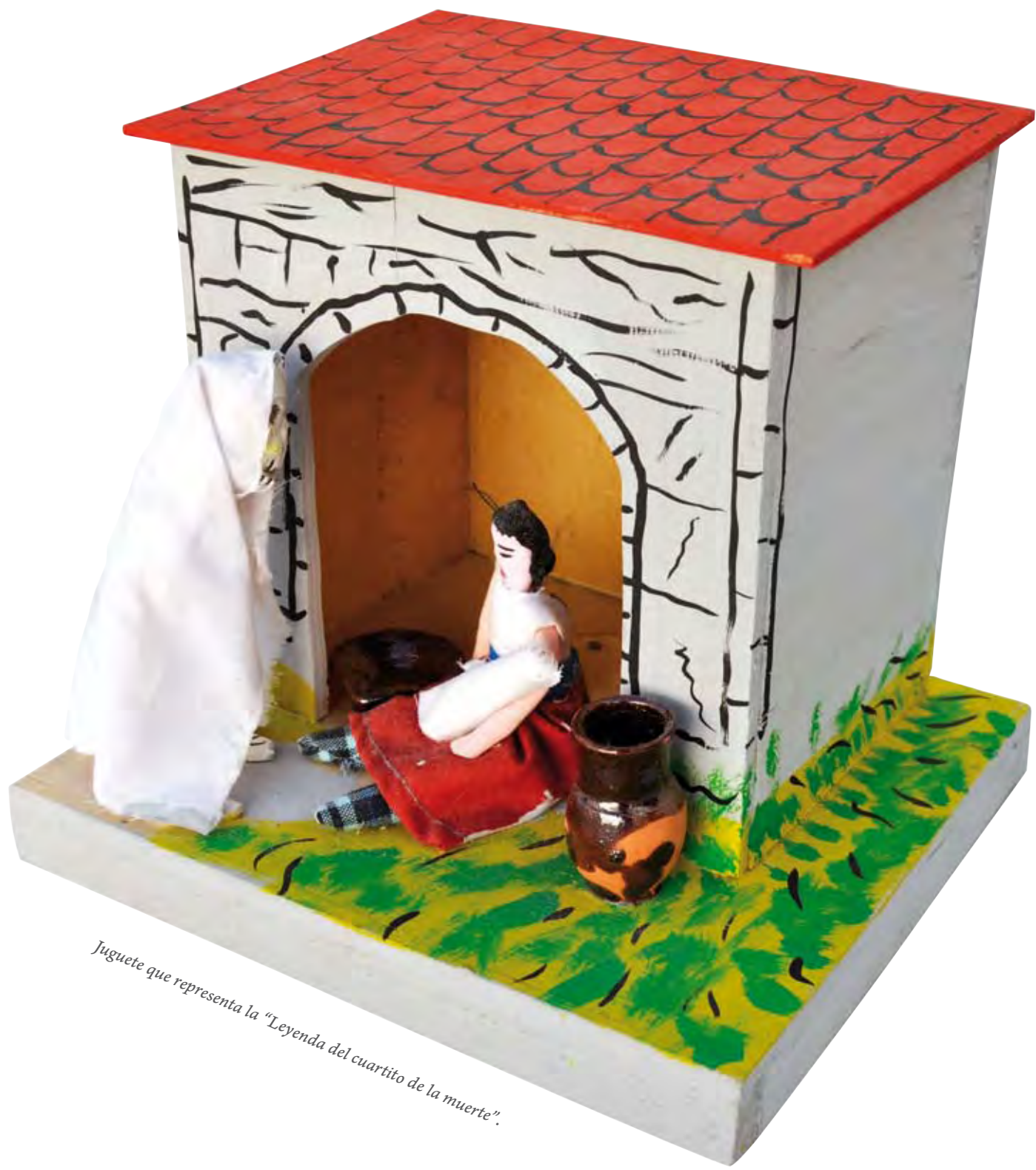
Juguete que representa la "Leyenda del cuartito de la muerte".