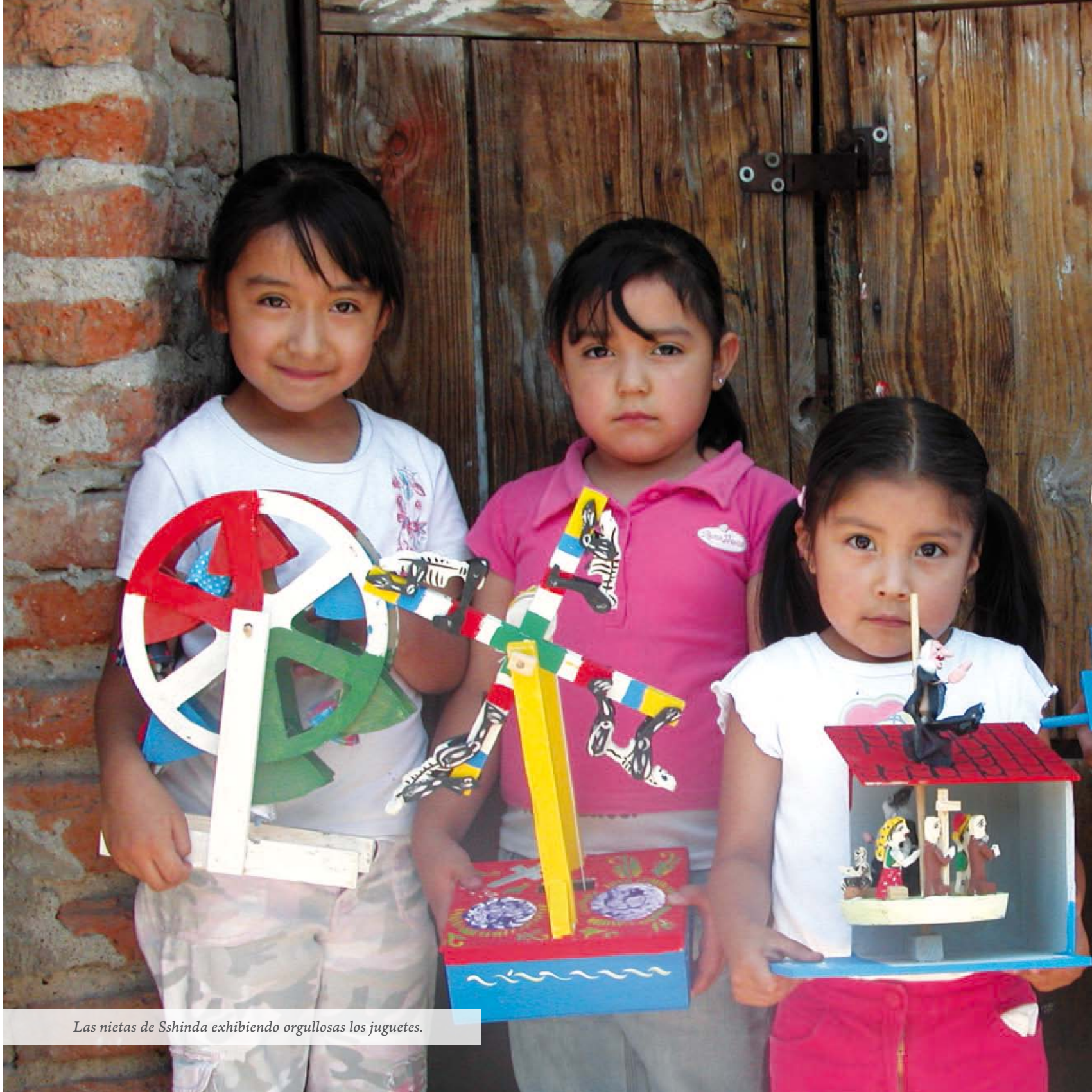
Las nietas de Sshinda exhibiendo orgullosas los juguetes.