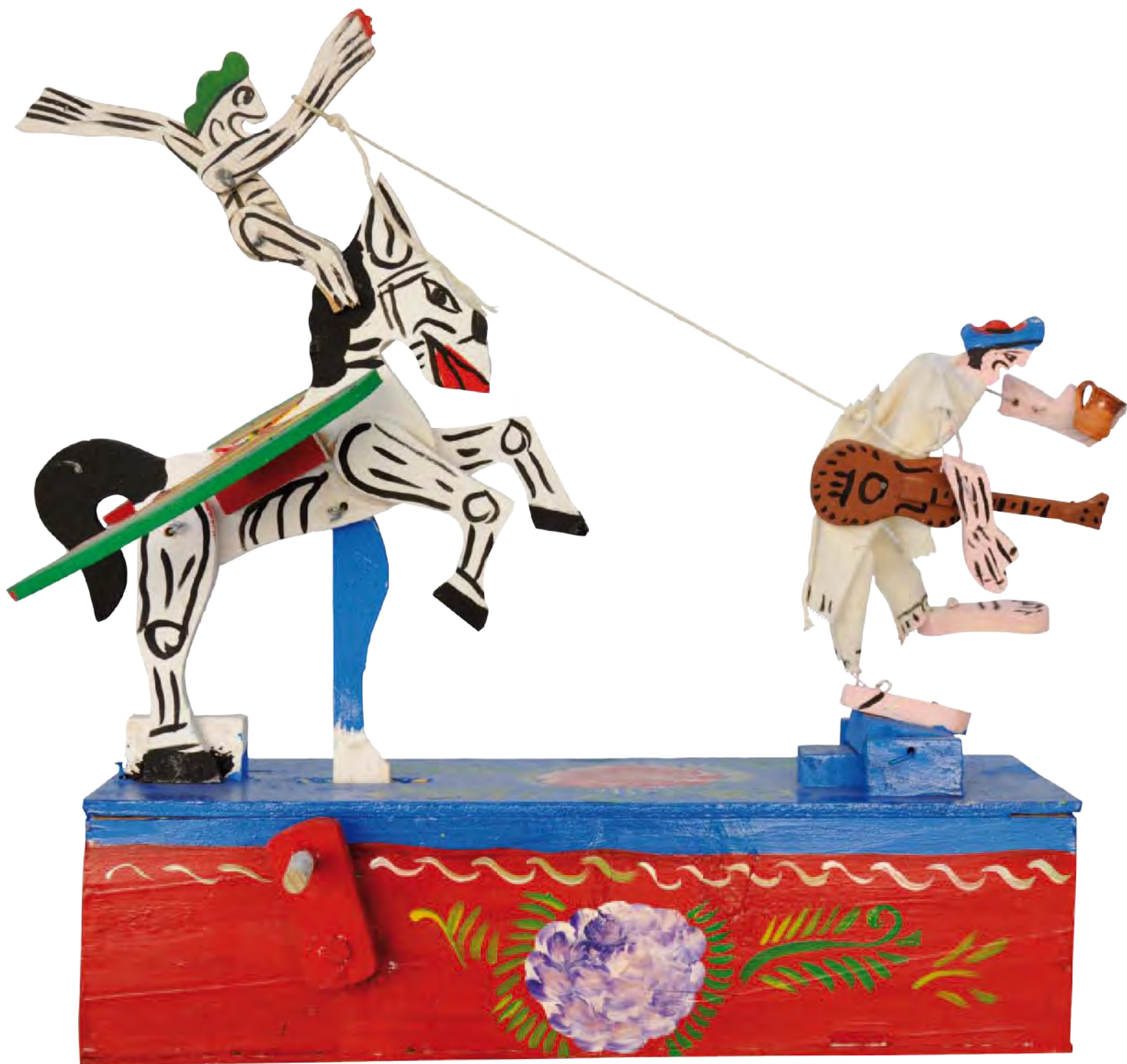
Caja de movimiento relativa a la "Leyenda de don Ambrosio".