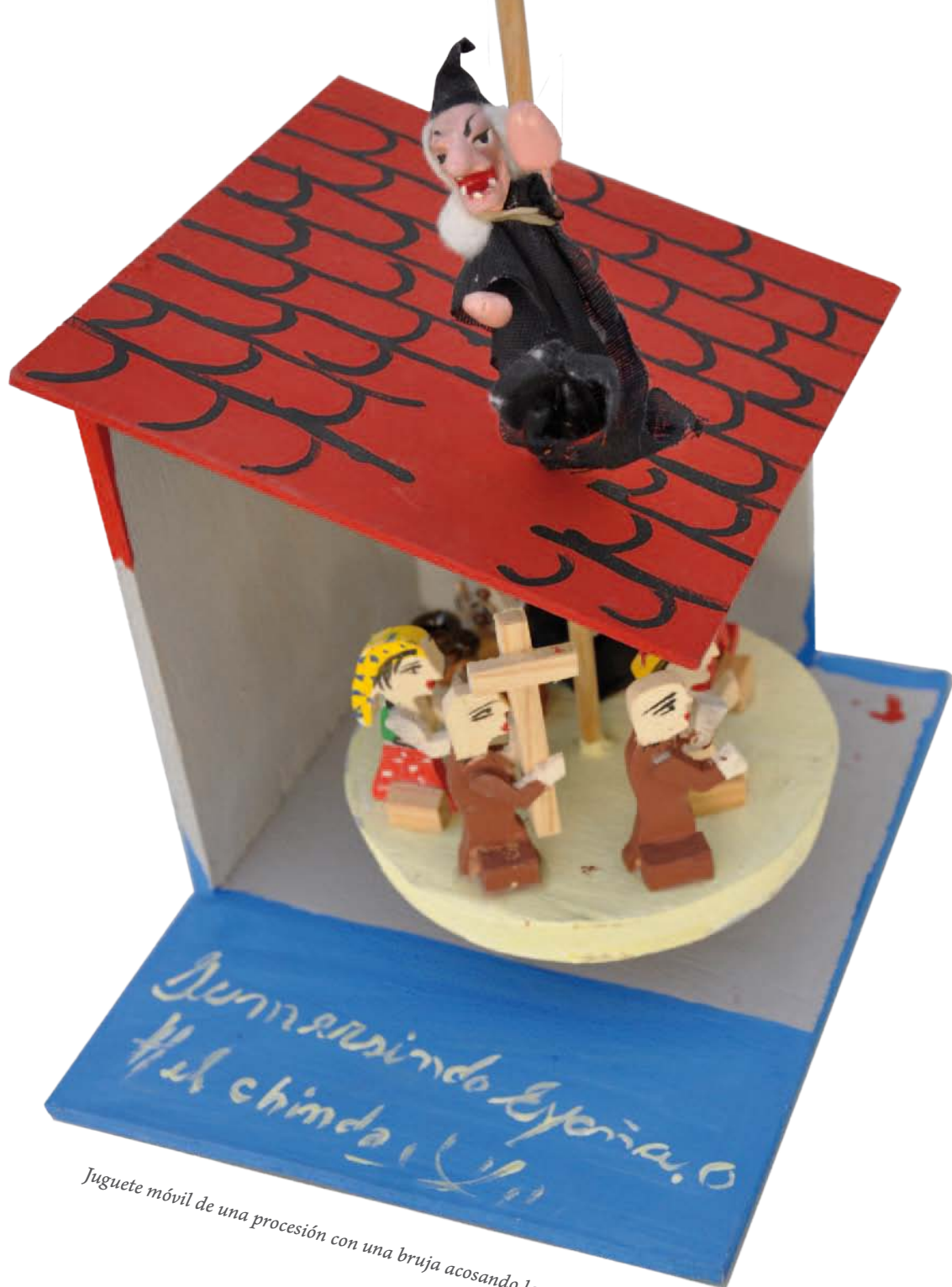
Juguete móvil de una procesión con una bruja acosando la peregrinación.