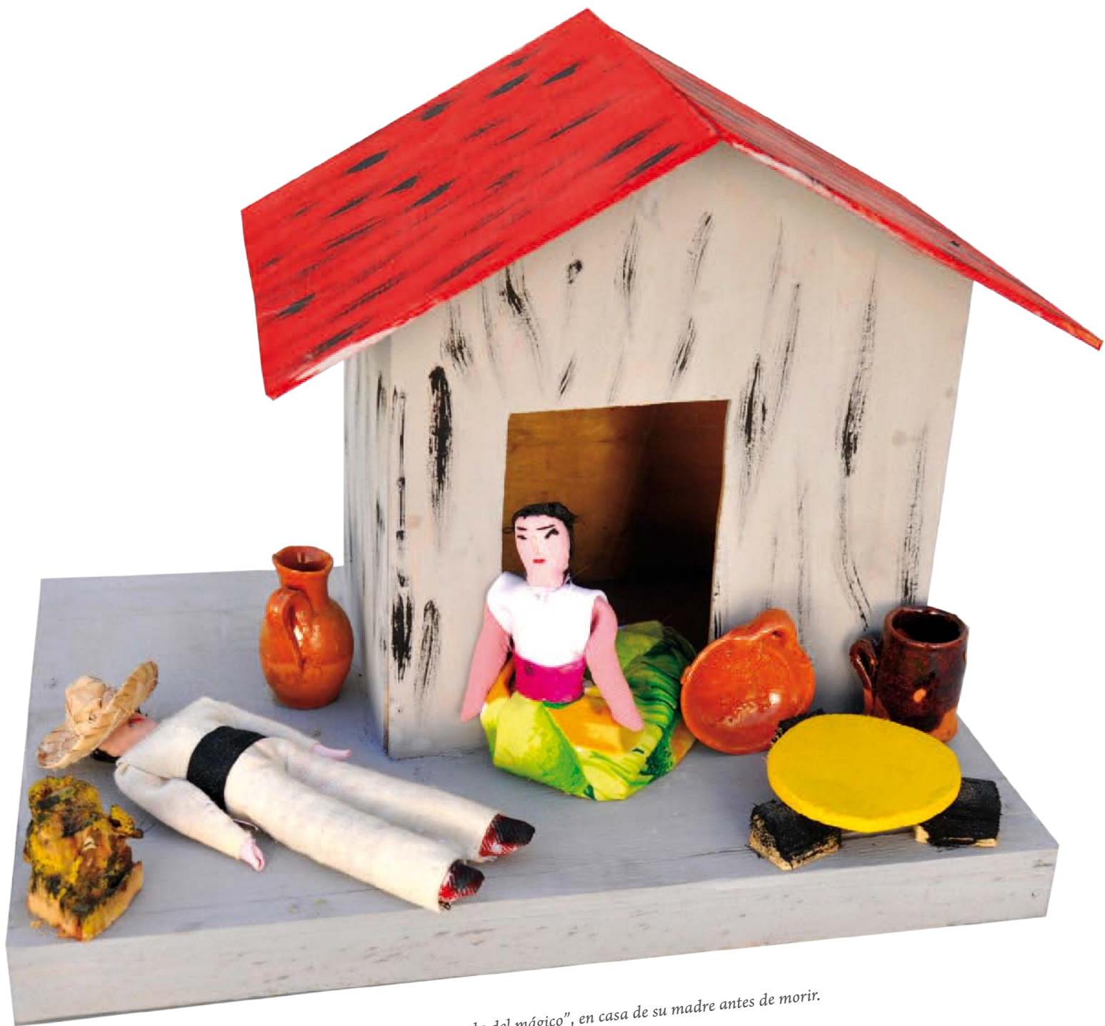
Juguete que refiere a la "Leyenda del mágico", en casa de su madre antes de morir.