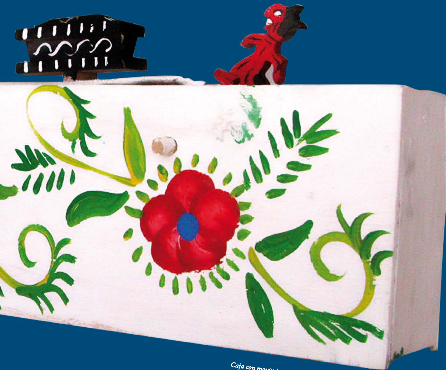
Caja con movimiento de la procesión de un funeral.