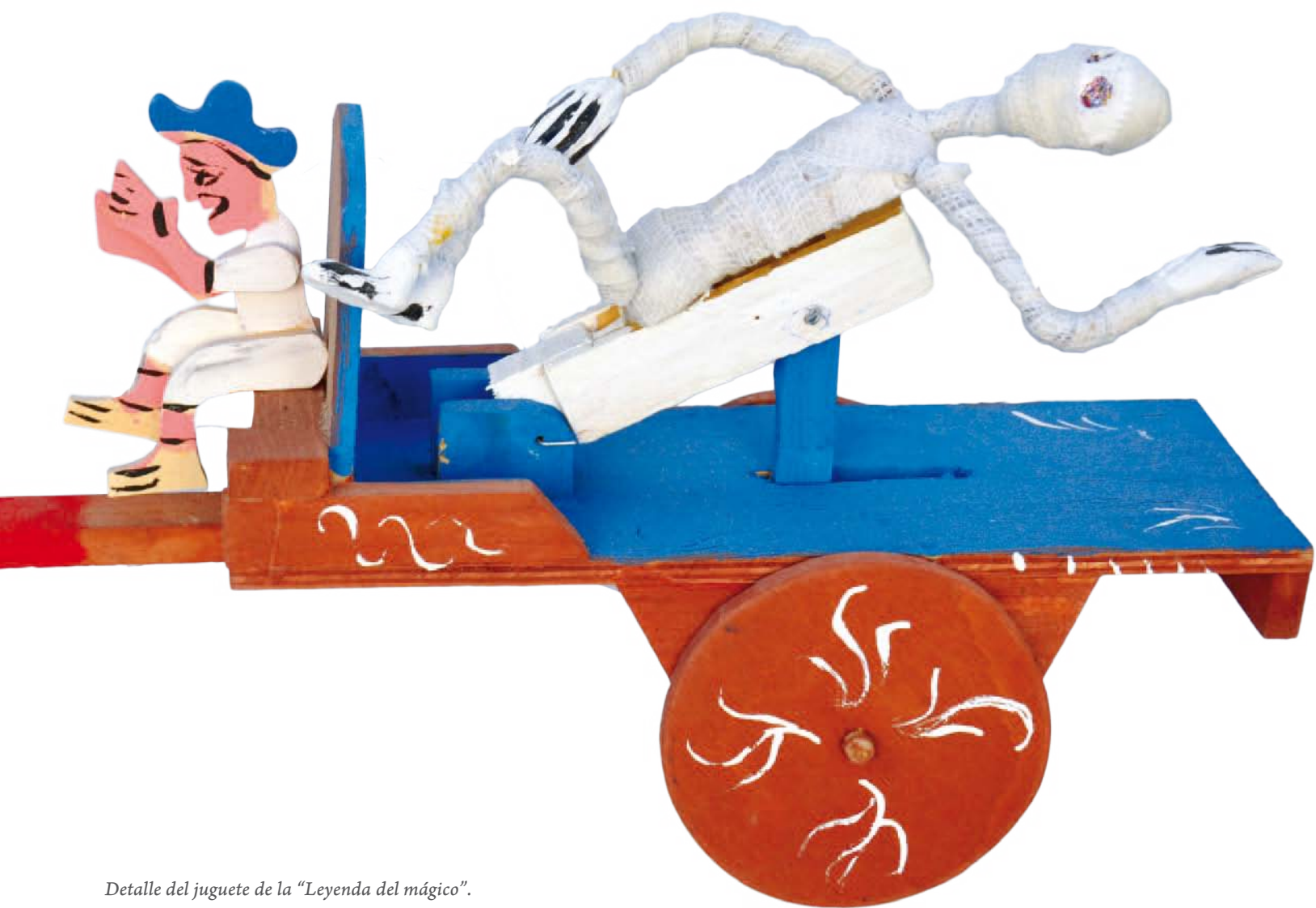
Detalle del juguete de la "Leyenda del mágico".