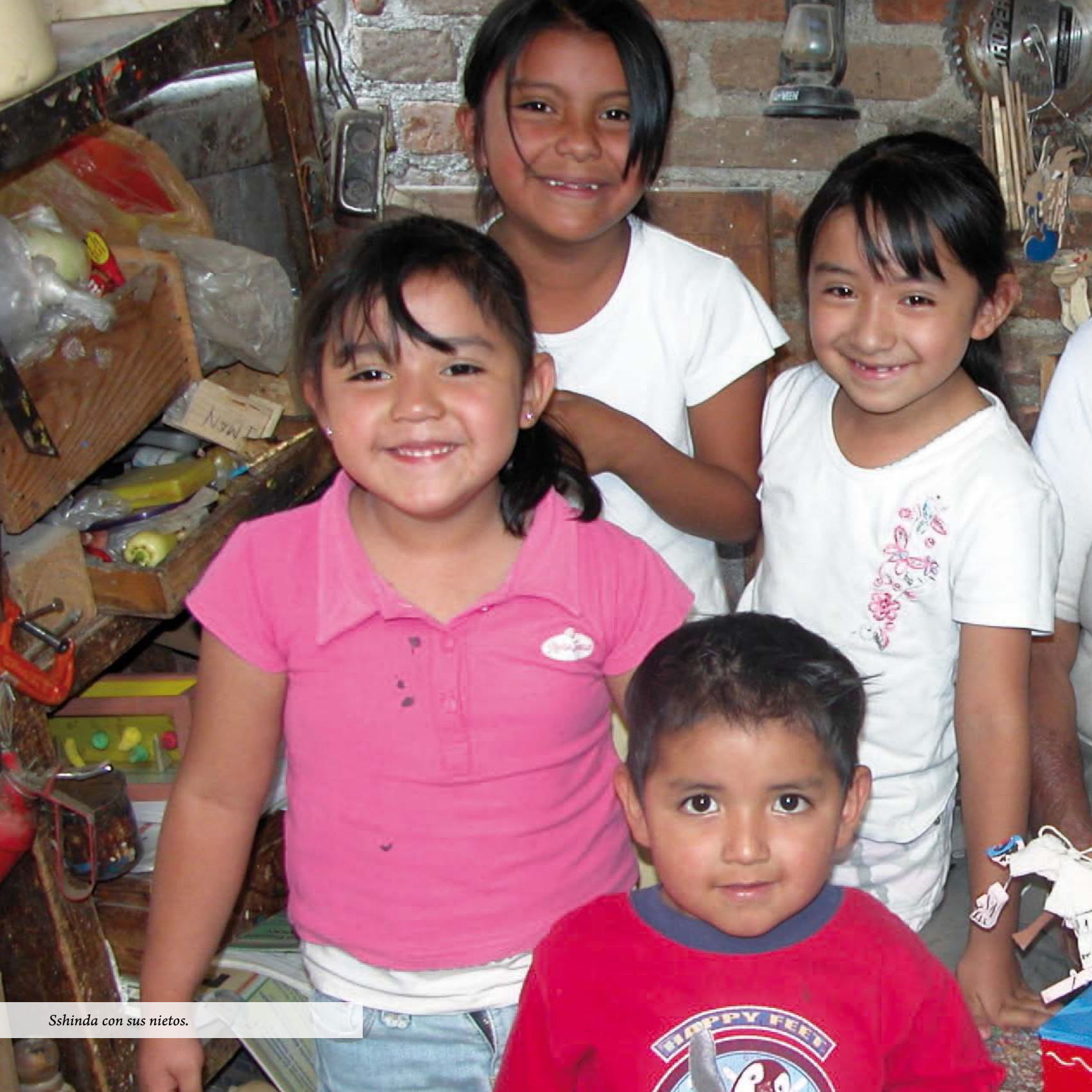
Sshinda con sus nietos.