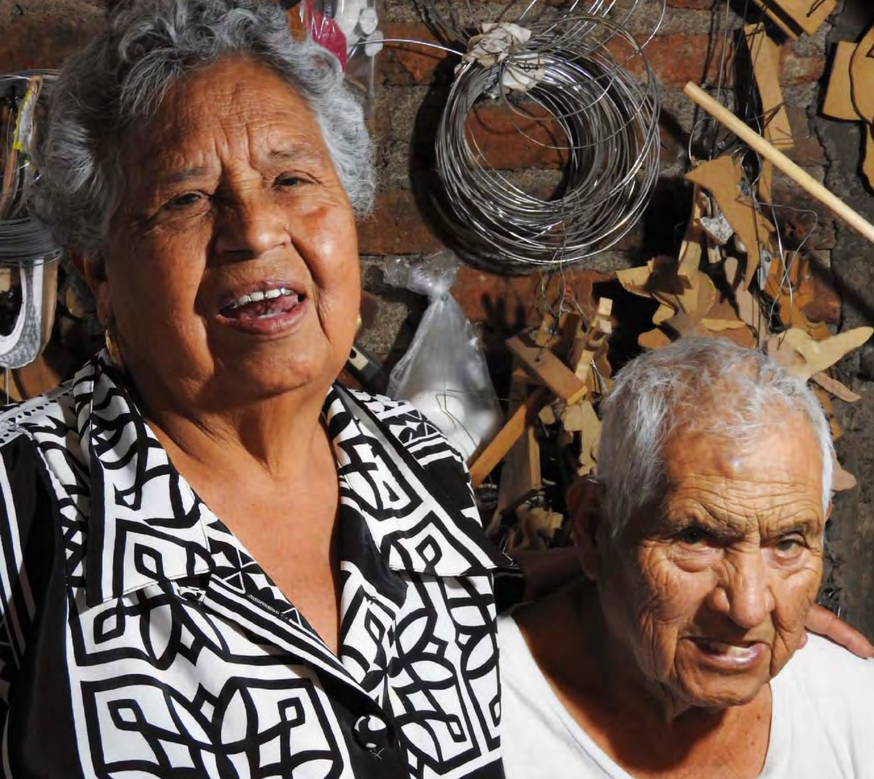
Sshinda con su hermana.