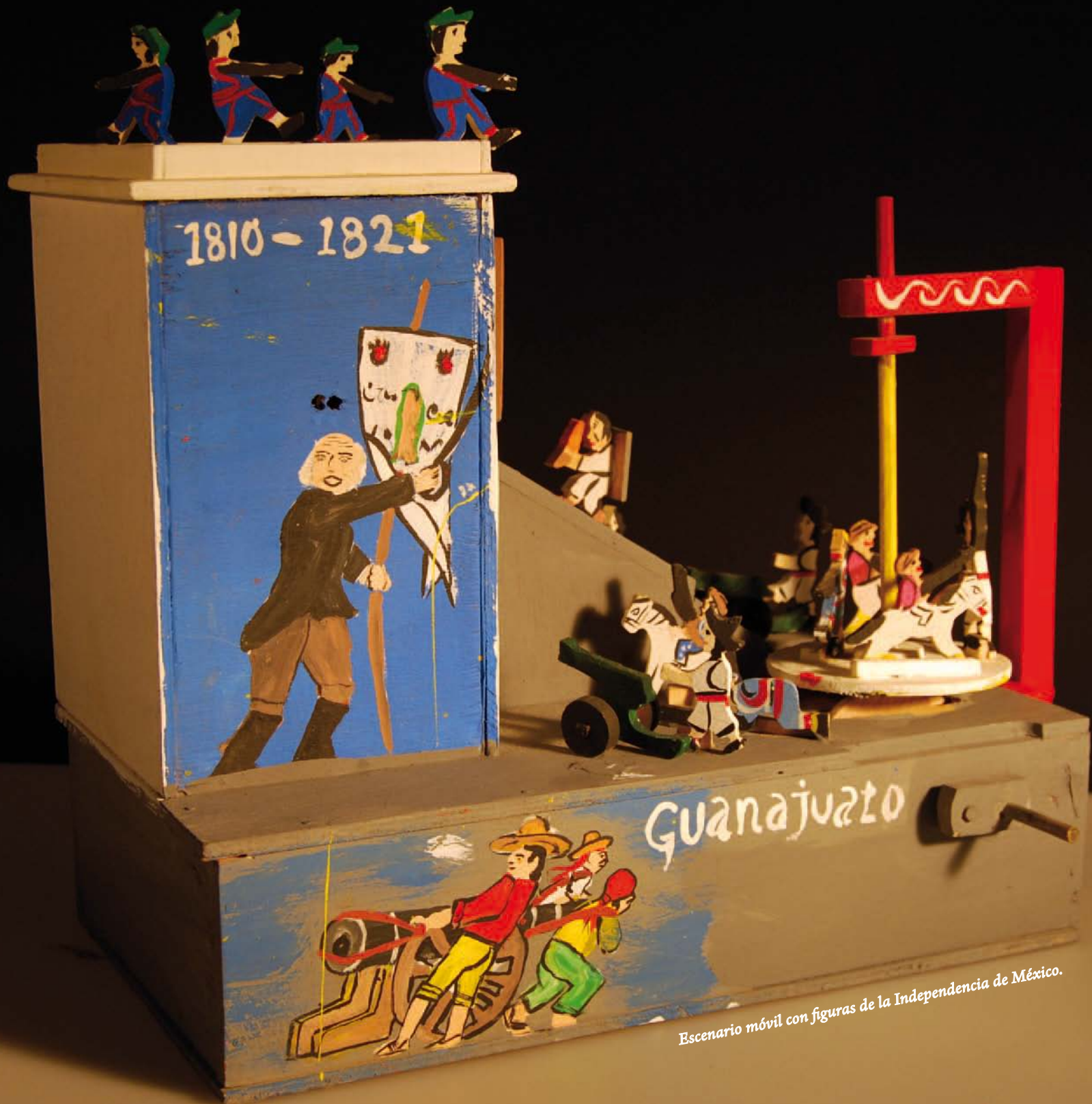
Escenario móvil con figuras de la Independencia de México.