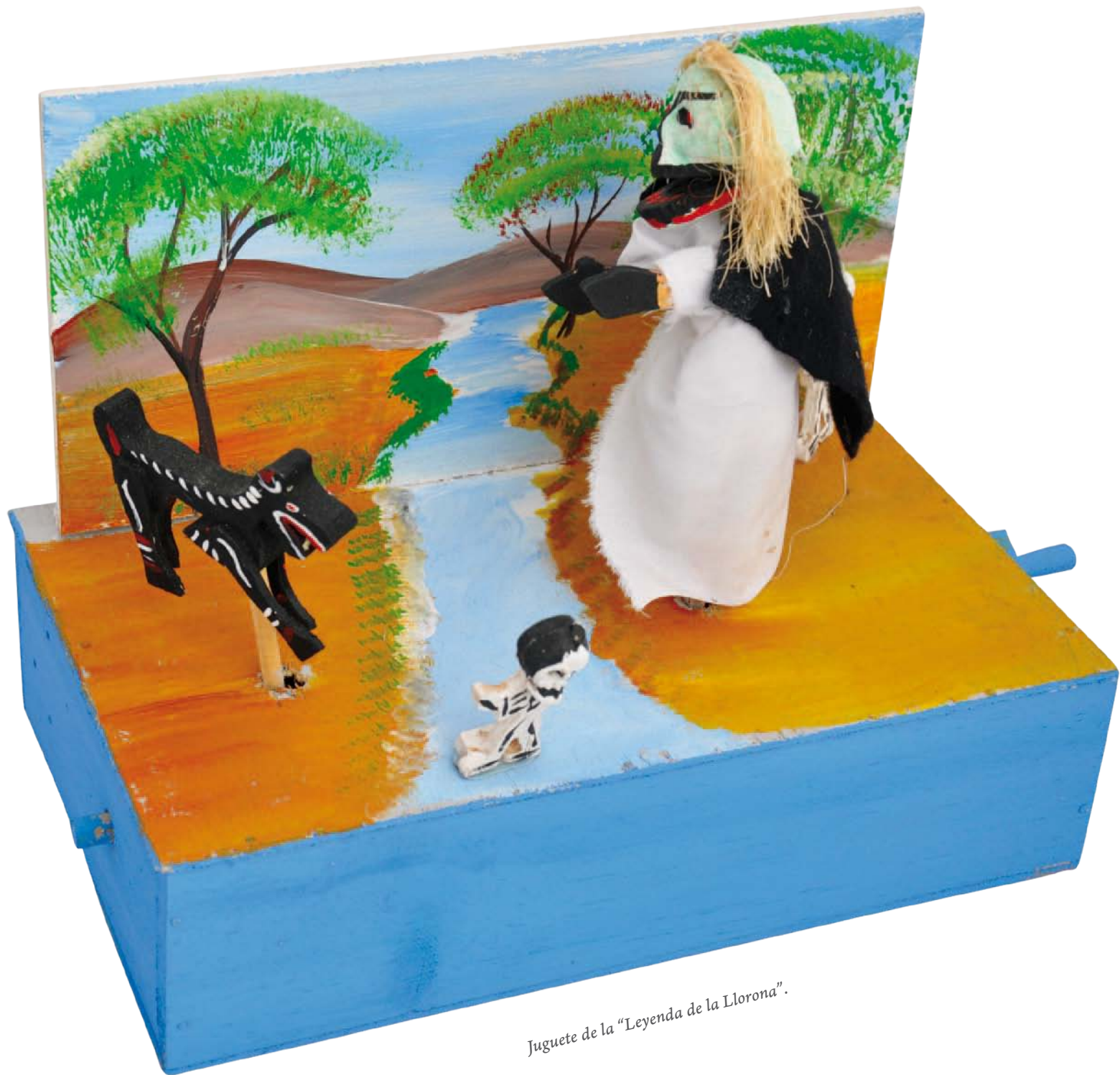
Juguete de la "Leyenda de la Llorona".