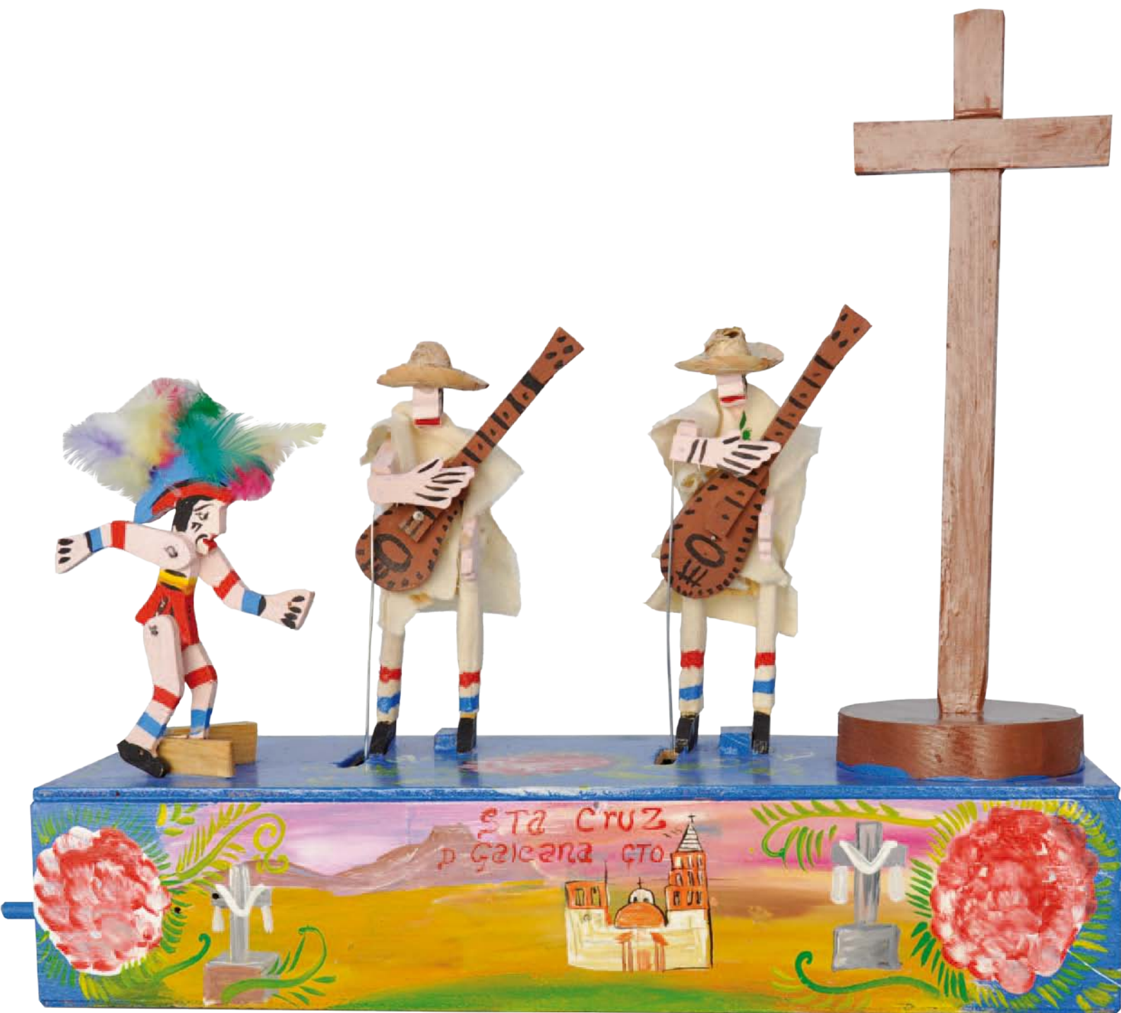
Caja móvil que representa la "Danza de Concheros" y retablo con motivos del lugar.