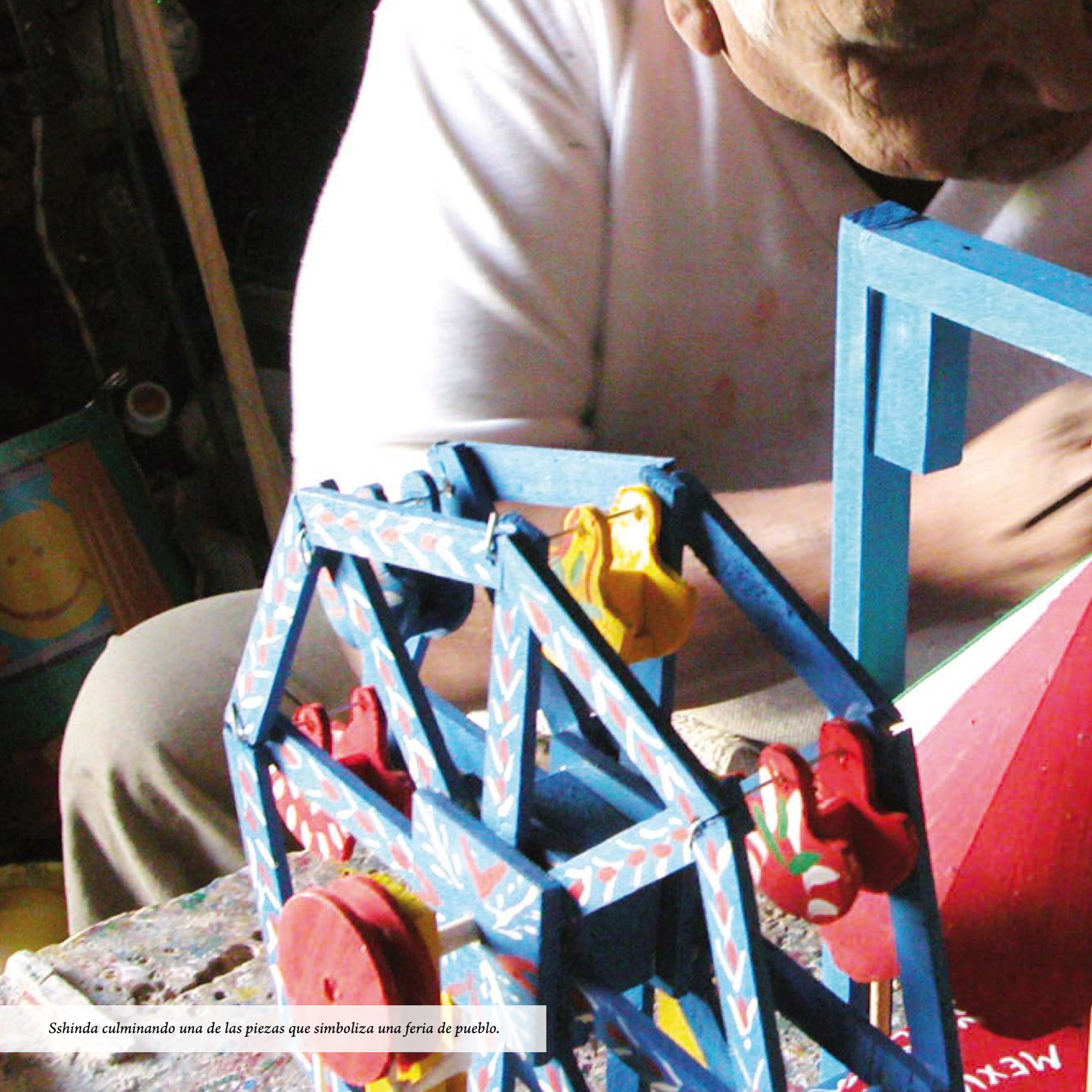
Sshinda culminando una de las piezas que simboliza una feria de pueblo.