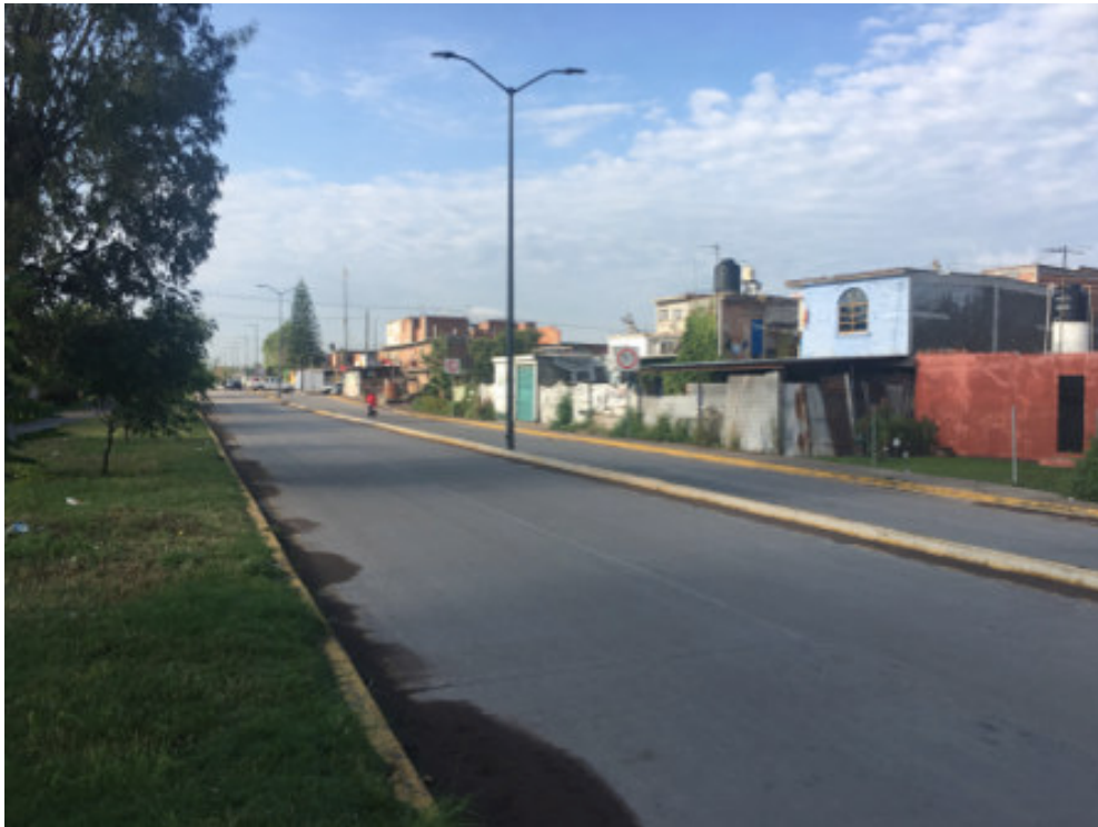
Figura 2. Vías de comunicación al inmueble