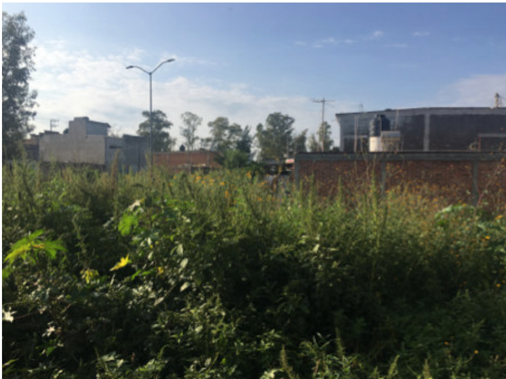
Figura 4. Colindante Norte, terreno baldío, sin poseedor ni propietario