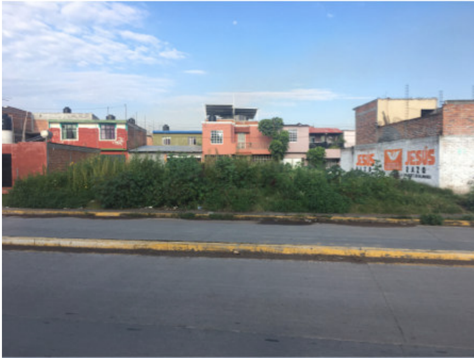
Figura 1. Vista al frente del inmueble