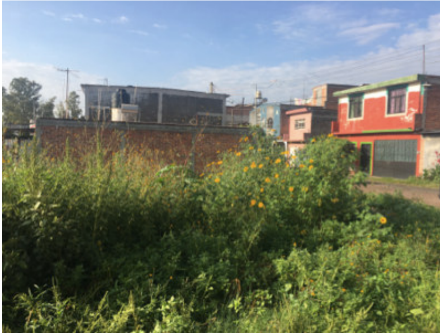
Figura 5. Camino de terracería en parte posterior del predio