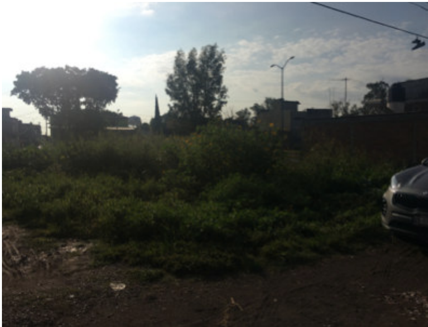
Figura 6. Vista posterior del predio, acceso calle Saturno