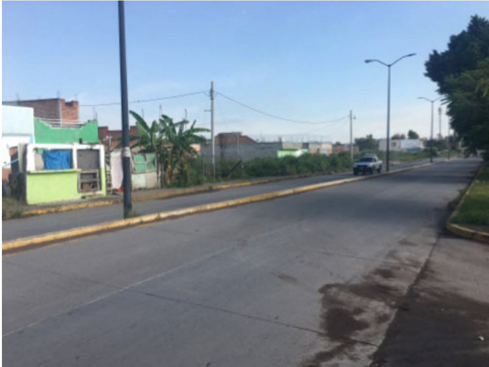
Figura 3. Colindantes al predio en condición de construcción precaria