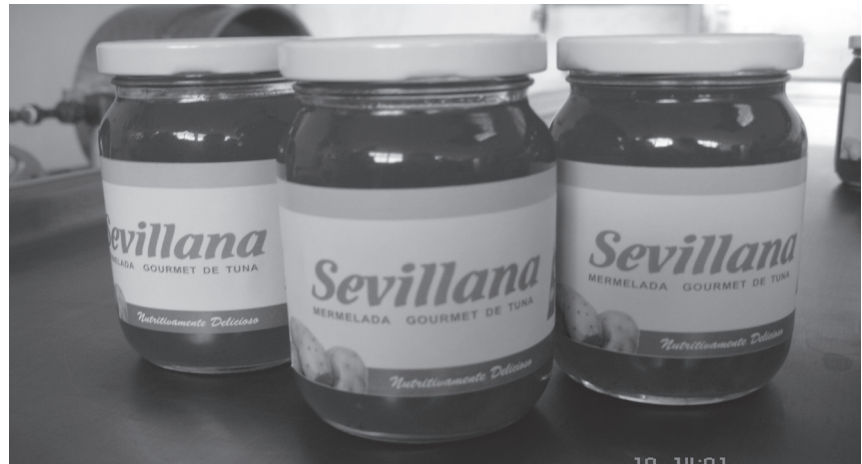
Figura 3. Mermelada de Tuna.