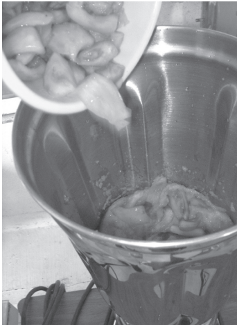
Figura 2. (a) Despulpadora, (b) triturador.