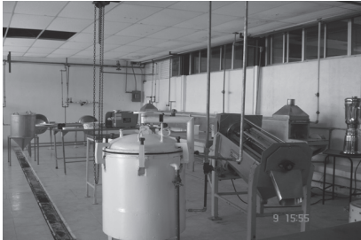
Figura 1. Planta piloto para la elaboración de mermeladas.

acidez alta (pH por debajo de 4.6), razón por la cual el tratamiento térmico aplicado fue de pasteurización (Ramaswamy and Marcotte, 2006). El producto terminado se muestra en la figura 3, en donde el frasco de mermelada lleva una etiqueta, diseñada con la información nutricional (figura 4) requerida para su posible comercialización.