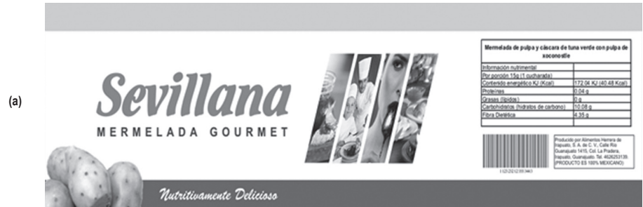
Figura 4. Diseño de etiqueta.

El análisis químico proximal de la mermelada de tuna procesada a nivel planta piloto, se muestra en la tabla 1, donde se observa que la fibra dietética fue de 29.06 g / 100 g de producto. El alto contenido de fibra dietética en la mermelada de tuna fue debida al aporte de cáscara (5.7 %) en la formulación. Se ha reportado un trabajo de investigación de mermeladas de tunas rojas, con aporte de 22.38 % de cáscara en la formulación, logrando un valor de 12 g / 100 g de fibra dietética en la mermelada elaborada (Arias y Herrera, 2008). Al respecto, es importante mencionar que la cáscara de tunas verdes posee una dureza considerable proporcionada por la fibra, a diferencia de la cáscara suave de las tunas rojas, de aquí que es posible considerar que la cantidad de fibra dietética en la