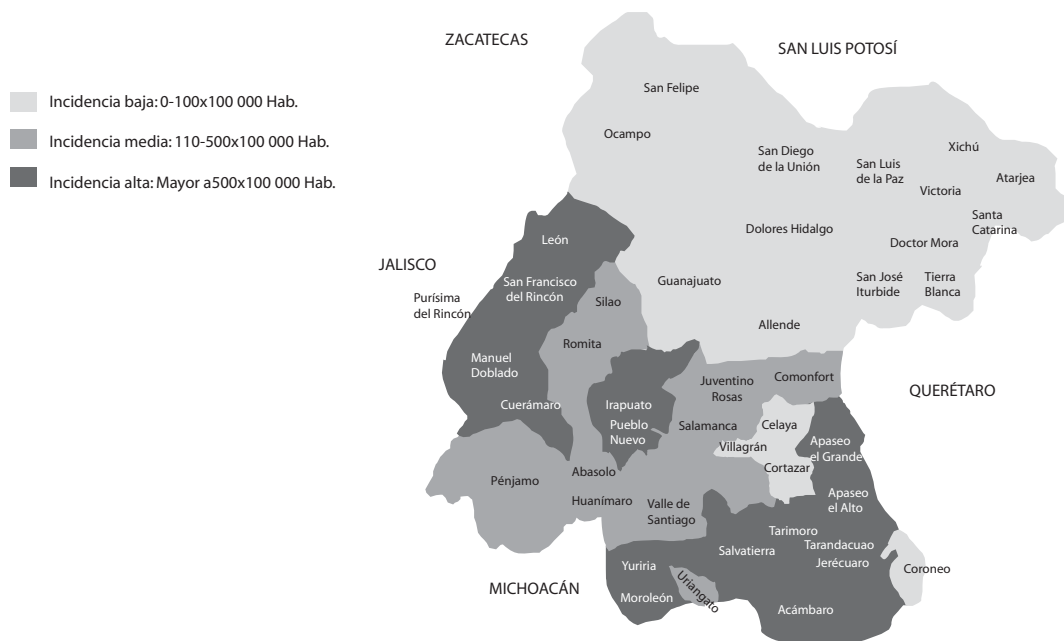
Figura 1. Tasa de Incidencia de picados por Alacrán 2000-2005

confiables para la programación de las actividades, la ubicación correcta de las acciones de prevención en tiempo y lugar por parte de las autoridades de salud, permitirá optimizar recursos humanos y materiales con mejores resultados, para disminuir la incidencia de un problema que tiene un comportamiento estacional y al parecer una distribución geográfica y climatológica definidas.