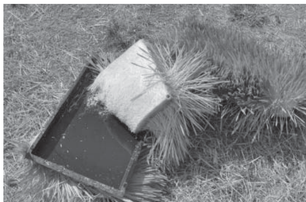
Figura 8. Se aprecia el tapete conformado por la relación paja/grano/sistema radicular, así como su sanidad.

tiempo, con un suministro de agua, el FVH puede durar de (2 a 3) días más, pero no se recomienda extender el tiempo de cosecha, pues el contenido nutricional empieza a alterarse significativamente y pierde mucho valor nutritivo (Valdivia, 1996). El FVH se debe ofrecer combinado con otros alimentos de tal forma que la ración sea completa.