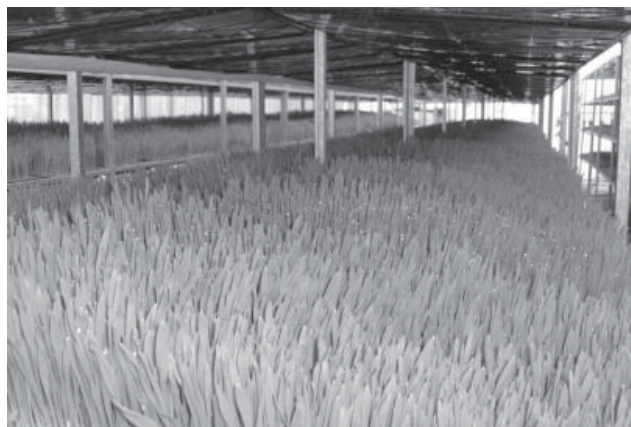
Figura 7. Crecimiento alcanzado por el forraje verde hidropónico con riego por goteo.

El forraje producido debe ser ingerido el mismo día de cosecha, lo que no impide almacenarlo por más