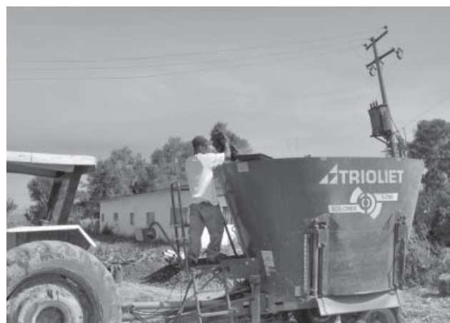
Figura 5. Equipo utilizado por el productor para obtener una mezcla más uniforme en la alimentación del ganado lechero.

El costo del FVH se determinó con base en la cantidad requerida por charola y su conversión a un kg de FVH, basándose en la producción de 9 kg de FVH por charola. Se calculó el costo de la semilla, considerando un kg por charola a $2,15/kg; el empleo de 6,92 litros de agua a 0,17 centavos/litro; el desinfectante empleado fue a razón de 250 ml para el total de charolas, a un costo de 0,95 centavos/charola; el jornal de mano de obra a $5/charola/8 días. El costo de la inversión inicial e infraestructura fue de $186 685,25 valor que se amortizó a siete años, considerando una producción de 504 kg/día en un lapso de un año.