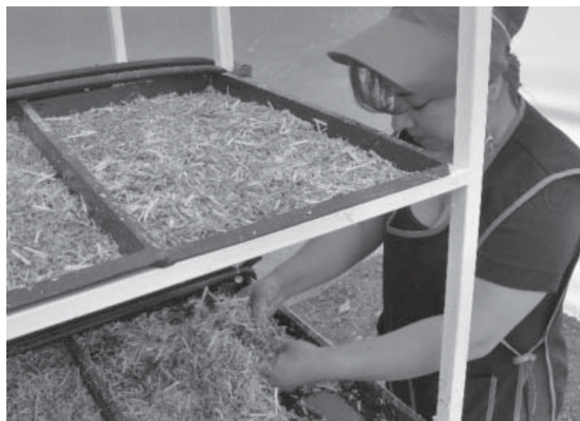
Figura 6. Preparación y desarrollo del forraje manejado con riego por goteo.

El tiempo de riego empleado fue de 2 minutos cada 2 horas por sector, aplicándose 12 riegos durante un día con un total de 24 minutos/día/riego/sector, mencionado por Romero (2009).