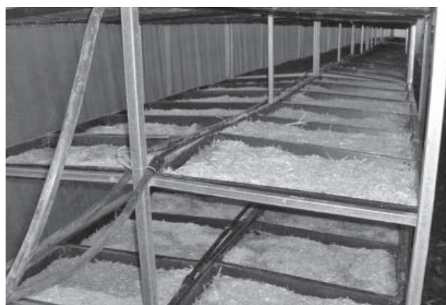
Figura 4. Colocación del sistema de riego por goteo a lo largo de los módulos de producción de FVH y la distribución de la humedad generada a lo largo y ancho de las charolas de germinación.

Para evitar problemas de falta de uniformidad en la distribución del agua en la charola se utilizó paja de trigo molida, en una mezcla de paja/grano de 200 g de paja por 600 g de grano de cebada, dicha mezcla se distribuyó a lo largo y ancho de la charola, éstas tenían una inclinación de 1,0 cm (1,5% de pendiente) lo que garantizó un escurrimiento adecuado favorecien-