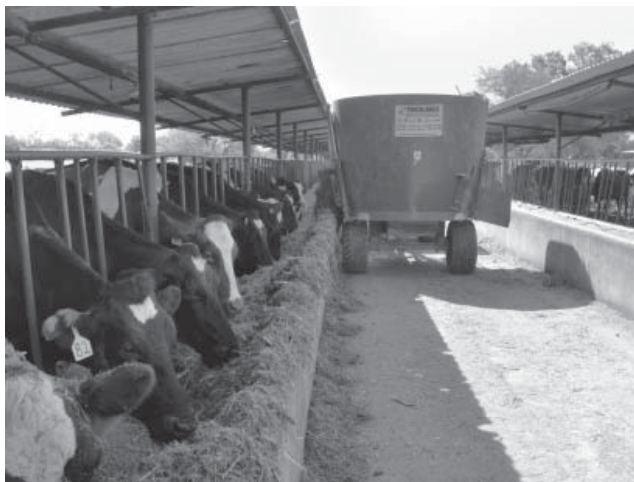
Figura 9. Alimentación del ganado con la mezcla de forraje verde hidropónico.

Una vez obtenida la producción se procedió a ofrecer FVH mezclado con ensilado de maíz, concentrado, alfalfa y paja de sorgo, mezcla que fue excelentemente aceptada por los animales (figura 9). La aceptación del FVH concuerda con lo obtenido por Valdivia (1996), quien realizó pruebas de consumo en cerdos, ovinos, aves, equinos, camélidos y bovinos sin problemas de aceptación. Valdivia (1996), en una prueba de producción con ganado lechero, alimentó a cinco vacas durante 15 días con 18 kg/vaca/día, además de ensilaje de maíz, concentrado, rastrojo de maíz y melaza, granos de sorgo y maíz molidos y obtuvo los siguientes resultados: La producción de leche se elevó en un 18%; la producción de grasa fue un 15,2 % mayor en las vacas bajo estudio; durante seis días después de que se eliminó el suministro de FVH las vacas casi no consumían ensilaje y buscaban su ración de FVH.