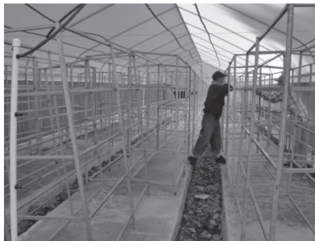
Figura 2. Vista de colocación de los sectores de riego.

Por cada sector se ubicaron charolas de (40 x 60) cm y por cada nivel se colocaron 60 charolas que multiplicadas por los 4 niveles utilizados arroja una cantidad de 240 charolas por sector de riego; la cantidad total que se emplearon en todo el macrotúnel para la producción de forraje verde hidropónico fue de 1 440 charolas. Para el sistema de producción se empleó el sistema de riego por goteo, con cintilla de calibre 6000