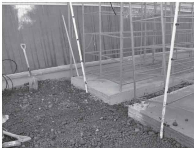
Figura 1. Dimensiones de los módulos para la colocación de las charolas de producción de forraje

En su interior se colocaron estructuras metálicas con PTRs de una pulgada, soldadas en forma de prisma rectangular con 2,40 m de largo x 1,20 m de ancho y 1,70 m de alto, conformada por 5 niveles separados a 45 cm cada uno de ellos (figura 1).