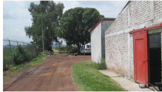
IMAGEN 3: Se pueden apreciar la entrada a la Granja "San Pedro" una de en las cuales se evaluaron los productos, ubicada en Pueblo Nuevo, Gto.