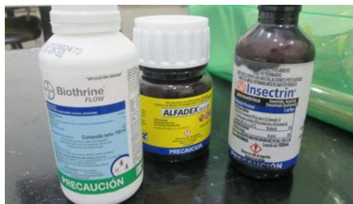
IMAGEN 1: Se pueden ver los productos en su presentación de marca comercial. Biothrine, Alfadex e Insectrin, que fueron los usados en el experimento.

Abbas et al. (2015) evaluó piretroides sobre mosca presente en granjas productoras de pollo de engorda [10] y encontraron que los piretroides comparados con los organofosforados no presentaron altos niveles de resistencia, a pesar que en el presente estudio no se utilizaron organofosforados concuerda de que el nivel de sobrevivencia de adultos de mosca doméstica fue moderado.