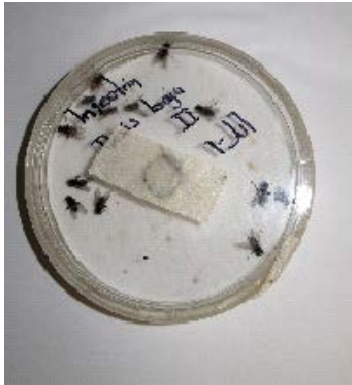
IMAGEN 2: Se pueden ver como quedaron los kits de insecticida una vez que se introdujeron las moscas para la evaluación de cada producto.