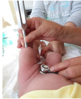
IMAGEN 1: Prueba de transmisión del sonido con extensión/Flexión.