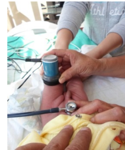
IMAGEN 3: Aplicación de Radar óseo.