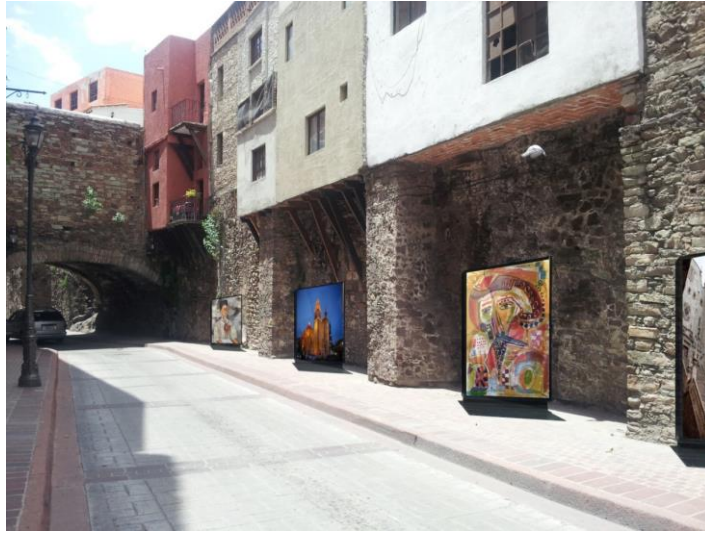
Figura 1. Perspectiva Calle Padre Belauzarán