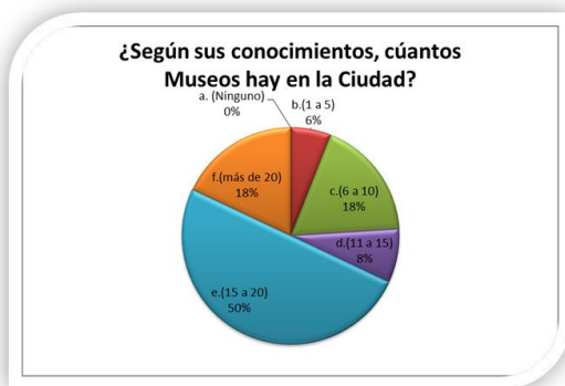
Figura 3. Porcentaje de turistas v residentes

Nos interesamos en saber si los turistas y la población de Guanajuato tiene conocimiento acerca de la oferta cultural que tiene la ciudad y al aplicar las encuestas nos dimos