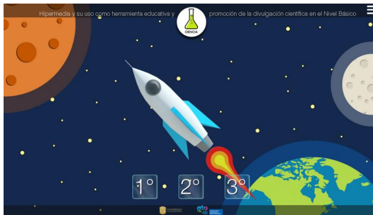
Figura 1. Página principal

Para la navegación principal se conformó un menú simple, tres iconos cada uno con el grado correspondiente, y la sección perteneciente al título es un botón que retorna a la página principal. El tema utilizado para todo el sitio consta de referencia al universo (ver figura 1).