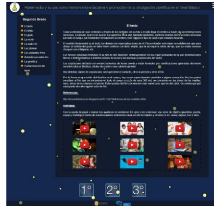
Figura 3. Página con contenido desplegado

Finalmente se encuentra un menú secundario en la esquina superior derecha, cuya tarea es la de contener los hipervínculos con otras partes del sitio que no tengan nada que ver con la navegación principal (área administrativa, créditos, descripción del proyecto y cualquier otra sección que pudiera ser necesaria.) de esta manera se evitan confusiones y se mantiene un esquema de navegación libre de complejidades. Así es como se encuentra configurado en “front end” del sitio, es decir la parte que las personas sin privilegios administrativos podrán visualizar.