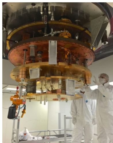
Figura 1. Mecanismo de CUORE.

Para la detección de materia oscura se toma como ejemplo a CUORE (Cryogenic Underground Observatory for Rare Events), ubicado en Gran Sasso, Italia a 3650 metros por debajo de las placas de roca.