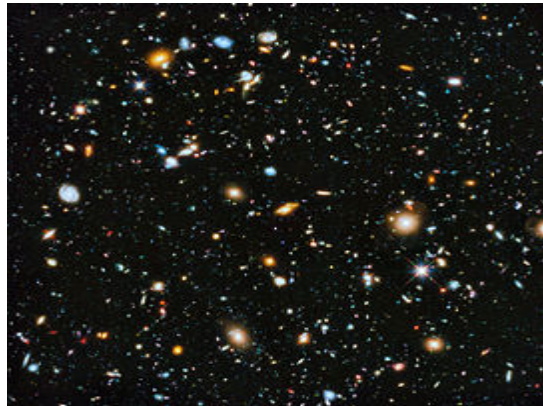
Figura 1. Composición del Universo.

El Universo (figura 1), tan impresionante y vasto, está constituido por materia, materia oscura y energía oscura; de ellos, solamente el 5% es materia y el restante porcentaje corresponde a materia oscura y energía oscura, aproximadamente en un 28.5% y 66.5% respectivamente [1].