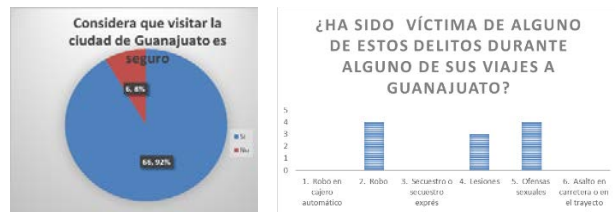
IMAGEN 3. Percepción de la seguridad