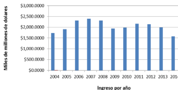
Imagen 1.- Historial del ingreso de remesas al Estado de Guanajuato de enero de 2004 al 1 de julio de 2014