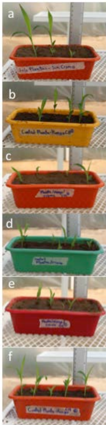
FIGURA 2. Efecto de hongos micorrizicos en la germinación y crecimiento de S. vulgare en presencia o ausencia de cromo en el suelo. Donde a, control sin cromo y sin hongo; b, sin cromo y con la cepa C11; c, sin cromo y la cepa C19; d, control con cromo y sin hongo; e, con cromo y la cepa C11; f, con cromo y la cepa C19.