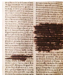
IMAGEN 2: Rayado en varios párrafos con tinta ferrogálica. (BV 4610 G6 1668)