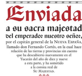
Imagen 5: Muestra tipográfica de la fuente Espinosa Nova.