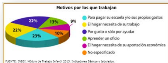
IMAGEN 3: Motivos por los que la niñez mexicana trabaja.

Se observa en el gráfico anterior que la razón por la que la mayor parte de los niños trabaja a nivel nacional es para pagar su escuela y/o sus propios gastos (23%). Y respecto a los movimientos latinoamericanos que promueven el reconocimiento, protección, promoción y defensa de los derechos de los niños, niñas y adolescentes trabajadores, encontramos los siguientes.