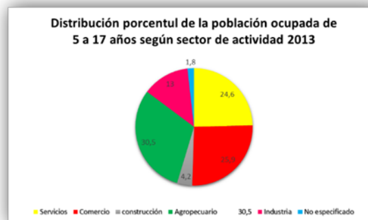
IMAGEN 2: Distribución de la población ocupada de 5-17 años según sector de actividad en México (2013).

Se observa en la gráfica anterior que en el escenario internacional, Asia despunta con el mayor porcentaje de niños que trabajan. Para el caso de nuestro país encontramos que la niñez (por lo menos para el año 2013) se encontraba ocupada en las actividades siguientes: