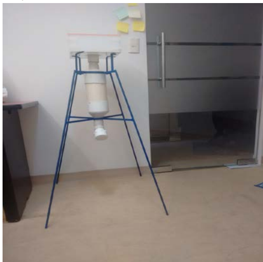
IMAGEN 4: Muestra de agua de lluvia obtenida del prototipo.