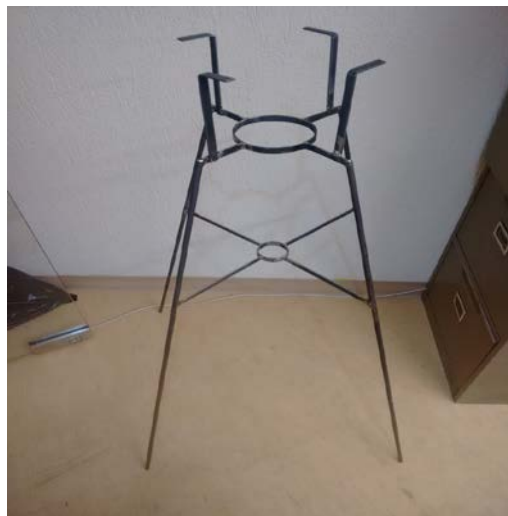
IMAGEN 2: Estructura de metal.

Kit de prueba para diversos metales mediante colorimetría (HACH).