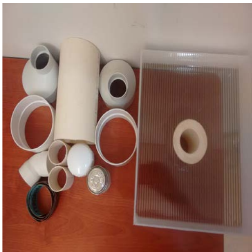
IMAGEN 1: Materiales utilizados.