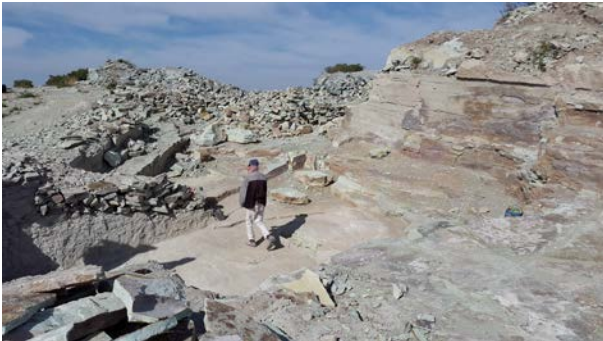
IMAGEN 6: Extracción de roca de la Formación Calderones

Descansando sobre la anterior, y en algunas ocasiones directamente con el Conglomerado, tenemos la Formación Calderones la cual está constituida principalmente por tobas andesíticas tipo lapilli, de color verde, dicha tonalidad la hace muy característica por la alteración realizada por la clorita, misma que es socorrida para su labrado por tener una coloración pocas veces vista; aunque puntualmente llega a ser color rojizo. Martínez Reyes [4], la describe como una sucesión de estratos gruesos (conglomeráticos) y delgados (arenosos), lo nombra Conglomerado Calderones. Con un espesor que varía de 200 a 250 metros. En su afloramiento se aprecian alteraciones que la vuelven un terreno frágil.