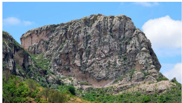
IMAGEN 5: Cerro de la Bufa, constituido por tobas riolíticas.

Formación Bufa, es una unidad de corta extensión, es la que forma la mayor parte de “Los Picachos”. Es una roca volcánica, masiva, de color rosa cuando está sana, blanquesina cuando es alterada (caolinizada). Con una composición mineralógica que incluye esencialmente cristales de cuarzo y feldespatos esparcidos dentro de una pasta vítrea. Su conjunto alcanza hasta 350 metros de espesor en promedio [3]. Por su textura la roca es muy apta para tratarla a modo de acabado de muros y pisos por su fácil labrado. Este tipo de roca, similar a la de la Formación Chichindaro, también es muy apta para filtro de agua, utilizada años atrás. A continuación la toba más representativa.