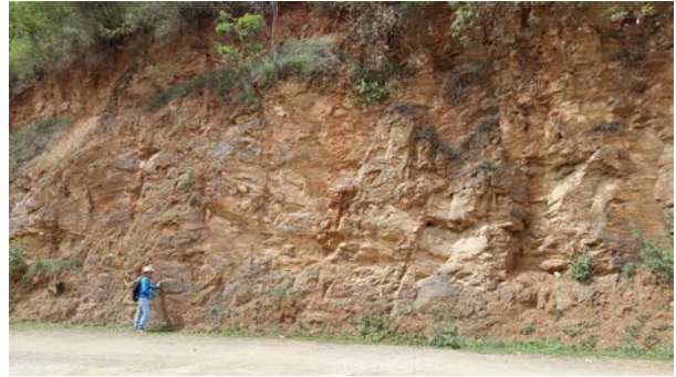
IMAGEN 2: Talud que muestra lutitas de la formación Esperanza, cercana a la presa que lleva el mismo nombre.

Las calizas, de menor abundancia, afloran en los alrededores de la presa de La Esperanza y Mellado. Este conjunto en su momento quiso ser explotado para la fabricación de cementos y de cal ya que las calizas son parte fundamental de la materia prima de dichos materiales de construcción. Se ubican en las inmediaciones de Llanos de Santana. Las rocas aparecen en horizontes, un conjunto de láminas que presentan una geometría bastante repetitiva, con espesores que van desde metros a decenas de metros, intercaladas con sedimentos terrígenos (provenientes del continente) que varían de acuerdo a su granulometría, siendo las más finas y abundantes.