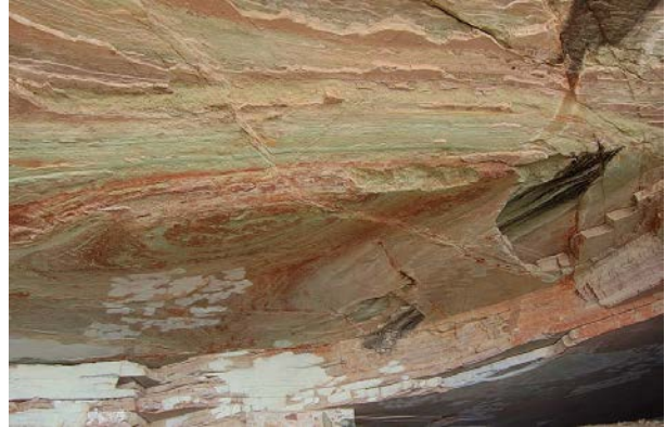
IMAGEN 4: La formación loseros en las inmediaciones del Cerro de la Bufa.

recubrimiento de calles en la ciudad, su geometría le es favorable para lo anterior. Tiene una buena calidad como roca.