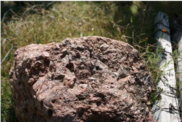
IMAGEN 3: Ejemplar de conglomerado rojo, se observan los clastos que la caracterizan como roca sedimentaria.

constituido por clastos de varios tamaños, como se presenta en la imagen 3, algunos muy finos, del tamaño de arenas, hasta bloques de varios metros, todos ellos fragmentos de rocas preexistentes con litologías variadas, de rocas volcánicas, plutónicas, sedimentarias y metamórficas, algunos de los clastos poco redondeados, soportados entre ellos, cementados por óxidos de hierro, éste imprime su coloración rojiza, y localmente por carbonato de calcio. El conglomerado como unidad alcanza varios cientos de metros de espesor. Es competente para la cimentación sobre éste y por su compactación inhibe el flujo de agua a través de él; sus horizontes de materia más fino, forma estratos bien definidos. Ha sido utilizado como bloque para construir, pocas veces labrado en forma de sillar, ejemplo más evidente de edificaciones es la Alhóndiga de Granaditas, además un vasto conjunto de ex haciendas, y muros de viviendas.