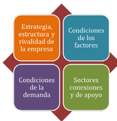
Figura 1: Los determinantes de la Ventaja Competitiva

Según Michael Porter cuatro son los componentes o determinantes de la ventaja competitiva que conforman el diamante, los cuales se ilustran en la gráfica a continuación: