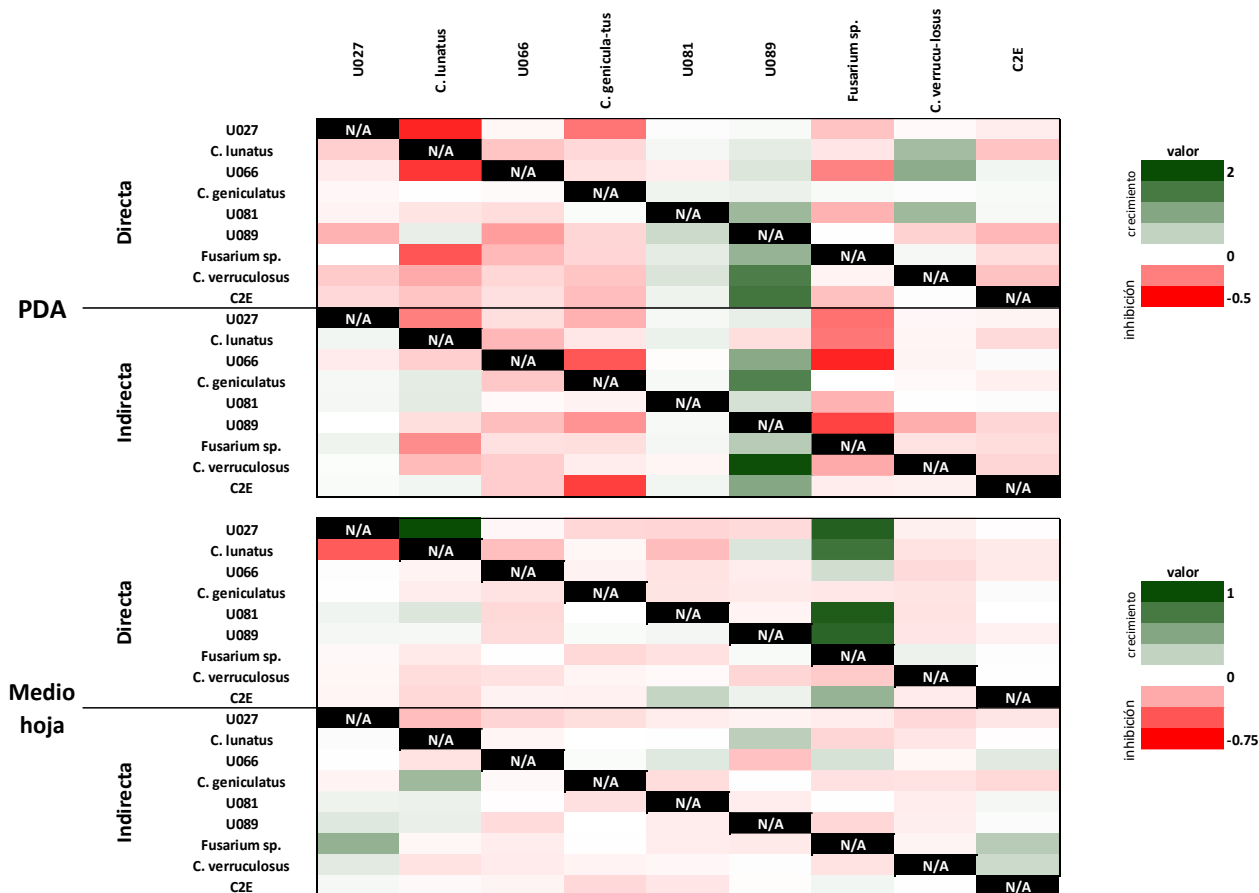
Figura 2: Heatmaps de los porcentajes de crecimiento e inhibición promedio en los 7 días de medición en los dos medios de cultivo y en las dos condiciones de crecimiento. Se muestra el efecto que tienen los hongos mostrados en el eje x sobre los hongos del eje y.

utilizó Microsoft Excel ® para la generación de los heatmaps y se tomó como número mayor y menor los valores más altos a los que se llegaba en cada caso.