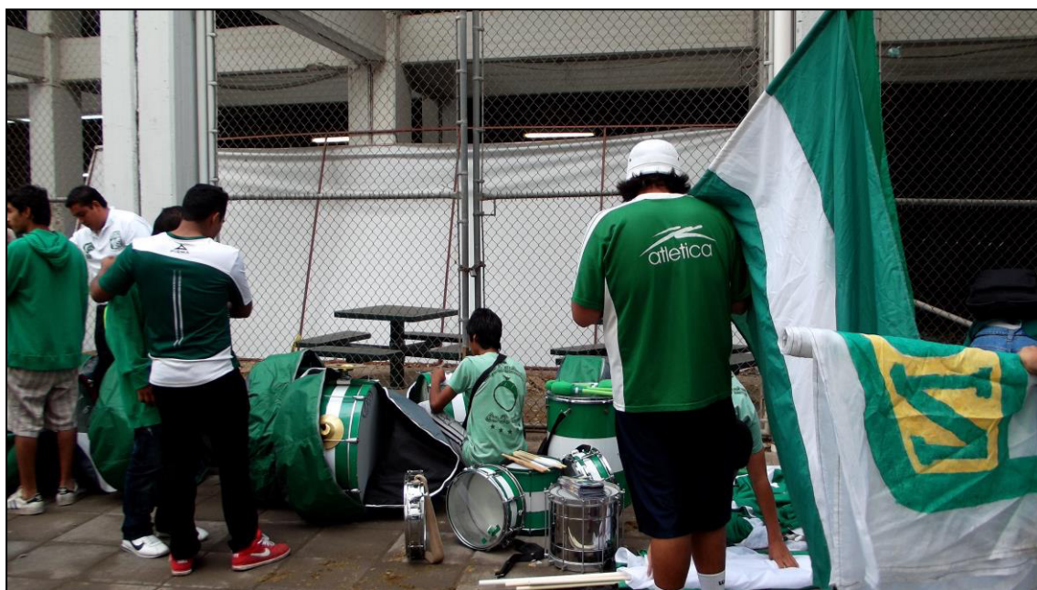
Figura 4. Integrantes de la murga Los Delirantes durante la preparación de sus instrumentos y banderas minutos antes de entrar al estadio Nou Camp .

integrantes, el lugar en el que la murga 53 ensaya por última vez antes de entrar al estadio. Es común que los integrantes del sector se reúnan horas antes del comienzo de cada partido para beber cerveza y fumar juntos, ya sea que decidan verse en la casa o incluso en el lugar de trabajo de alguno de ellos, quizás en la zona de la bodega para después irse a algún sitio cercano. En algunas ocasiones se forman equipos que trabajan en los alrededores del estadio vendiendo calcomanías o imprimiendo sellos con pintura corporal y el dinero que ganan se utiliza para cubrir el costo de futuros viajes a otros estadios.