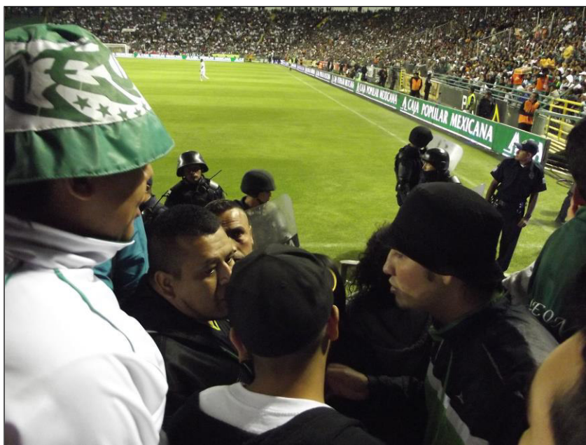
Figura 7. El representante-administrador de Los de Arriba y algunos representantes-líderes de sector tomando un acuerdo con elementos de la Policía Municipal mientras un integrante de la Vieja Guardia observa.

Son los representantes-líderes de sector quienes tienen como responsabilidad mantener el orden entre la gente que, como miembros de sus grupos, asisten a los partidos de futbol; mientras que el representante-administrador de la barra es quien funciona como intermediario entre cada uno de los líderes en momentos de toma de acuerdos.