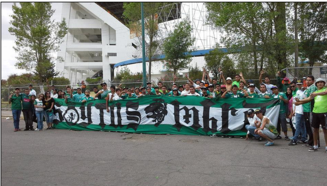
Figura 9. El trapo Soy Tu Sombra como emblema del Sector Sur.

Mientras que el segundo caso, el Sector Sur, distingue a sus miembros mediante el empleo de la calavera punk como símbolo de la clase popular y además la adopción del lema Soy Tu Sombra para señalar la fidelidad al Club León, lealtad que el aficionado demuestra al seguir al equipo a cualquier estadio en el que deba jugar, convirtiéndose en su sombra porque va con este a cualquier parte.