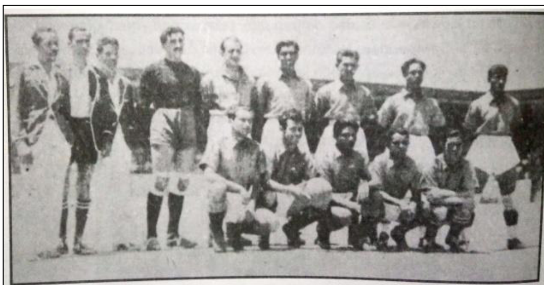
Figura 1. Debut del Club León en la Liga Mayor Profesional Mexicana el 20 de agosto de 1944. Fuente: Cruz Martínez, José (2008). “Capítulo 3. El debut del equipo León en la liga mayor” en Mis memorias del equipo León . México, Cortes e impresos.

que el nuevo equipo pudiese competir en la Liga Mayor de Fútbol Profesional mexicano. 17