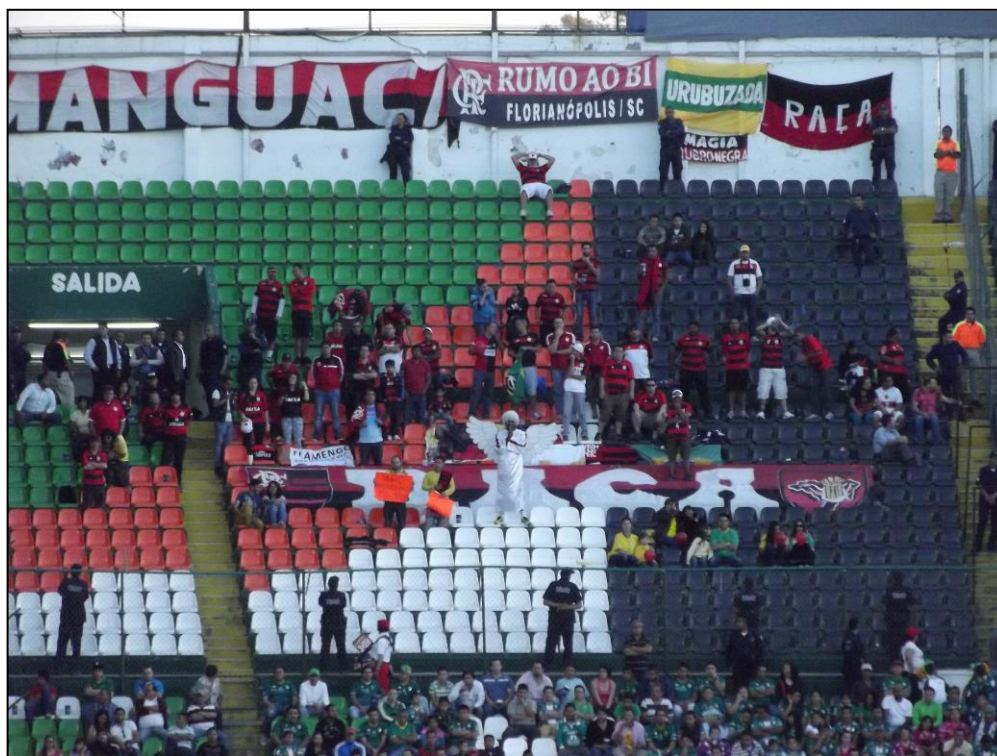
Figura 10. Aficionados del Clube de Regatas do Flamengo (institución deportiva originaria de Rio de Janeiro, Brasil) como visitantes en el estadio Nou Camp. En la foto: aficionados del Flamengo durante un partido disputado contra el Club León con motivo del Torneo de Copa Libertadores en el año 2014.

En momentos la barra invita abiertamente a los demás seguidores para que se unan a su atmósfera de apoyo con música, cánticos, banderas, trapos, etcétera; sin embargo, en otros momentos no se trata de invitar a otros seguidores a la unión sino sólo de enviar un mensaje de aceptación o rechazo a la barra visitante, por ejemplo.