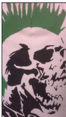
Figura 5. “La calavera punk ”, símbolo de la clase popular.

El segundo objetivo puede explicarse con el caso específico de “ la calavera punk ” un cráneo humano con una cresta color verde que ha sido plasmado en banderas y playeras. Este esqueleto representa la clase social de la que ellos se consideran parte: la clase popular. Se trata de un elemento que señala su condición socioeconómica. 82