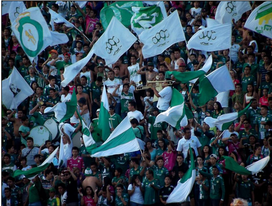
Figura 8. El carnaval y el color .

interior de la misma. Por ejemplo, cuando se da el manejo de elementos que los diferencian entre sí, tal es el caso de los símbolos de los que son portadores algunos de sus trapos, banderas, e incluso, canciones.