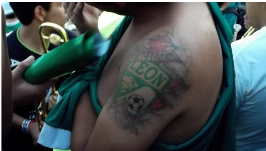
Figura 6. Durante el carnaval , un joven del Sector Santa María luce desnudo el brazo izquierdo y deja ver un tatuaje. La imagen plasmada en la piel corresponde al escudo del Club de Fútbol León al que lo atraviesa un listón con la leyenda “Sta. María” en alusión al sector al que este hincha pertenece.

Así pues, el carnaval de la barra Los de Arriba también tiene otros espacios como lugar de desarrollo, mismos que infringen los límites espaciales de su estadio como lo pueden ser las calles de la ciudad (cuando, por ejemplo, realizan una caravana que sale de un lugar emblemático para la ciudad de León: el Arco de la Calzada, para llegar al estadio Nou Camp) e incluso un autobús donde los hinchas viajan para trasladarse a su propio estadio o a otro en calidad de afición visitante.