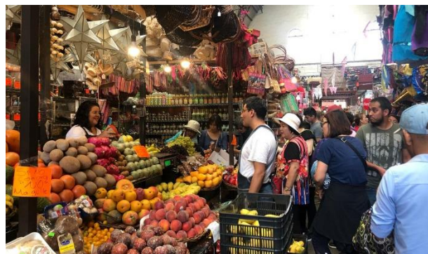
Ilustración 2. Puesto de frutas y verduras, elaboración propia del autor

Las relaciones que se crean en los mercados tradicionales rebasan aquellas que pueden obtenerse en otros espacios como supermercados y centros comerciales. El hecho de tener un trato totalmente directo con el vendedor del producto, incluso el dueño del local, hace que pueda