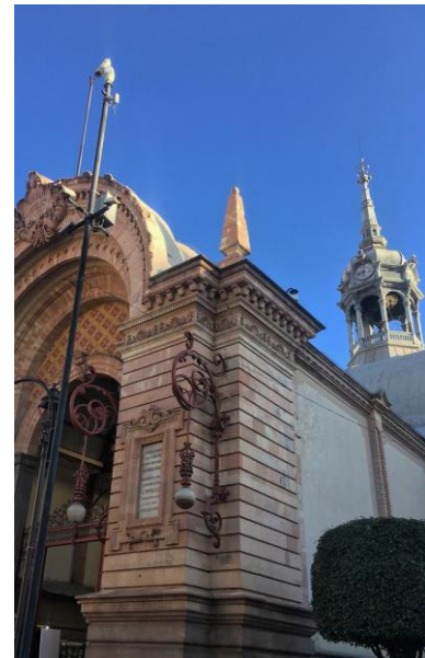
Ilustración 1. Mercado Hidalgo perspectiva, Lamas, Aldo, Giovanni

El mercado es un espacio de relaciones sociales constituidas entre las negociaciones y disputas por una forma de vinculación con los espacios públicos. La heterogeneidad es una de sus principales características, pues como reflejo de lo que ocurre en todo el ámbito urbano, son esencialmente diferenciados y se encuentran inmersos en desigualdades socioeconómicas y culturales (Lacarrieu, 2016:13). En los mercados existen dos formas de actuación pública simultáneas: las políticas