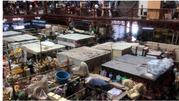
Ilustración 5. Elaboración propia del autor.

Se obtuvo información que deja ver que los locatarios del mercado consideran que las políticas públicas no enriquecen al mercado, sino que lo deterioran. Por otro lado, se obtuvo que es notable la falta de apropiación y de conciencia de conservación por