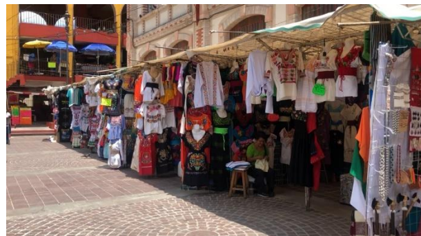
Ilustración 4. Puestos del mercado alrededor de éste, elaboración propia del autor.

En una entrevista con una de las vendedoras de artesanía, preguntamos acerca de la afectación que ella resentía por la existencia de una amplia zona comercial alrededor del mercado, confirmándose una afectación, calificada, sin embargo, de indirecta. Esta afectación se entiende