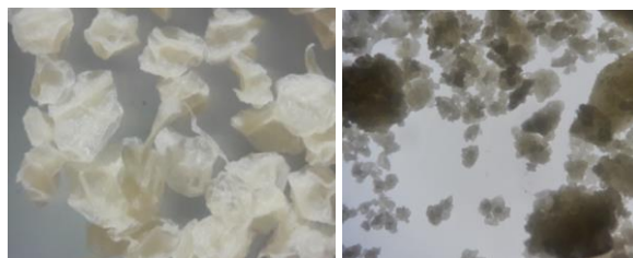
IMAGEN 1.1: Vista al microscopio de las partículas con mejores resultados de absorción en agua. Fotografía izquierda (Agar Bovino), Derecha (Agar nutritivo modificado).