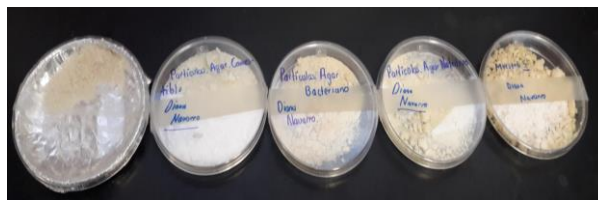
IMAGEN 1.0: Partículas de Gelatina-Siloxano, utilizando los distintos agares, de izquierda a derecha (agar: Bovino, Comestible, Bacteriano, Nutritivo, Nutritivo modificado).

Se sintetizaron 5 tipos de partículas utilizando los diferentes agares (Agar: Bovino, Comestible, Bacteria y 2 del tipo nutritivo). Ver imagen 1.0.