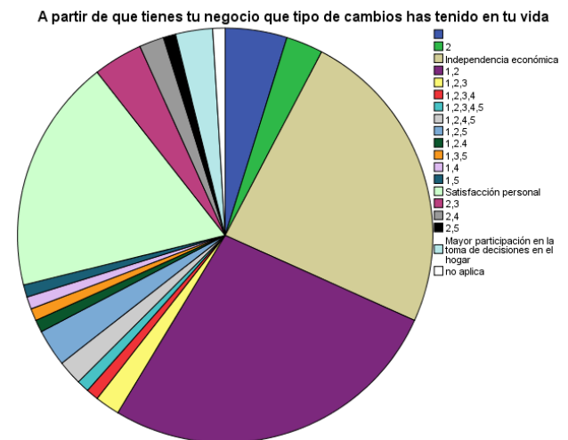
Gráfica 3: Cambios en las vidas de las mujeres al tener un negocio propio.