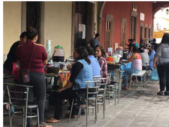
Imagen 1: Cenaduría “Los portales”

Posteriormente, entre las problemáticas principales para las mujeres que buscan emprender están la falta de apoyo de financiamiento y discriminación por parte de los de su ramo.