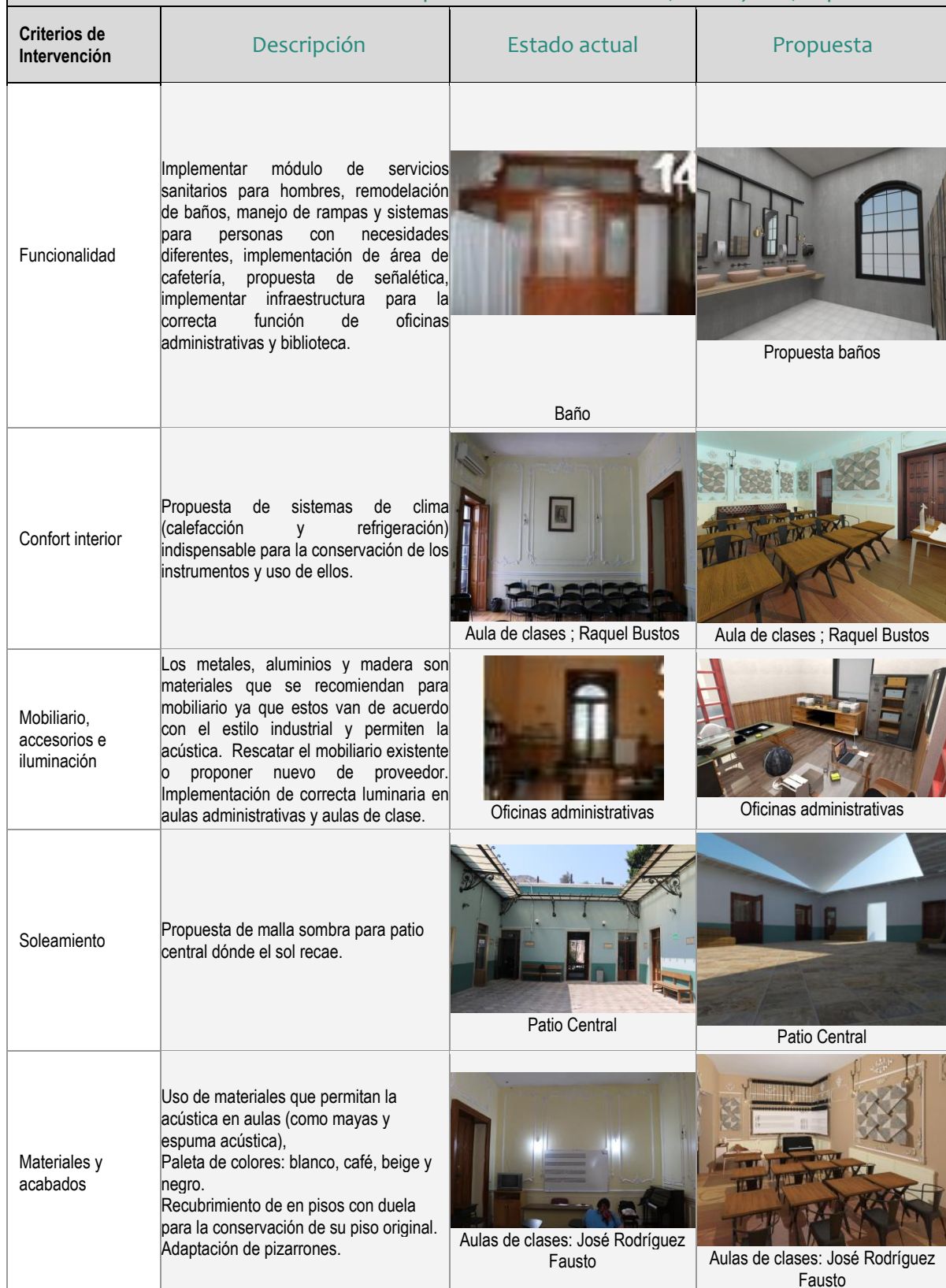
Tabla 01. Criterios de intervención para la Escuela de Música, Guanajuato, Capital