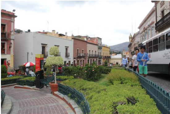
IMAGEN 1: Material videográfico de la ciudad de Guanajuato