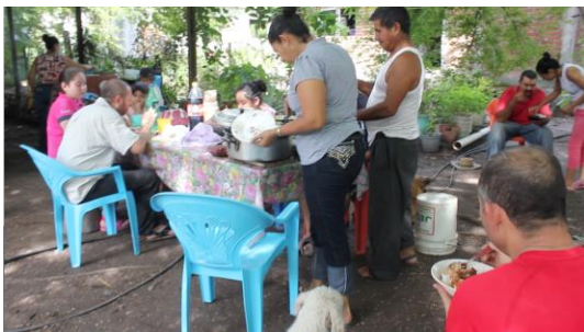
IMAGEN 3: Ejemplo de mi familia.