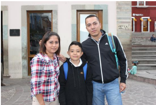
IMAGEN 2: Ejemplo de familias que transitaban la ciudad.