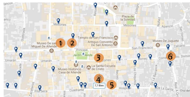
IMAGEN 1: Zona hotelera

Se realizó la consulta de la ficha más antigua de cada edificio patrimonial del INAH, la mayoría de ellas con fecha de elaboración de 1989, en donde tres inmuebles su uso de suelo pertenecían al comercio o habitacional.