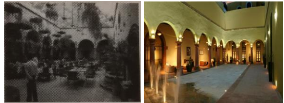
IMAGEN 6: La Morada