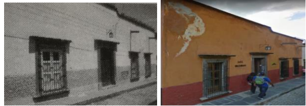
IMAGEN 3: Hotel Villa Santa Blanca