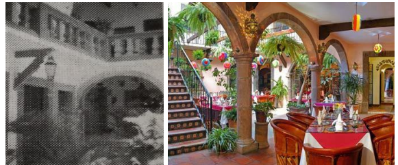
IMAGEN 7: Hotel Mansión Virreyes