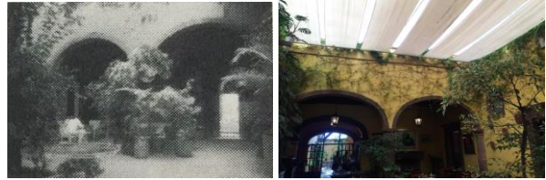
IMAGEN 2: Hotel Sierra Nevada Quinta Real