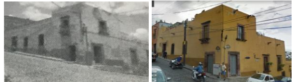
IMAGEN 4: Hacienda las Amantes