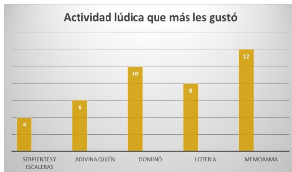
Imagen 7. Se realizaron 5 juegos de mesa con diferentes temas de química, siendo el preferido entre los alumnos el memorama.

De los juegos aplicados, la favorita de los alumnos fue el memorama. De igual manera calificaron el contenido de los juegos donde el 15% consideró que el contenido era muy bueno, 45% bueno, 35% regular y el 5% restante calificó el contenido como malo.