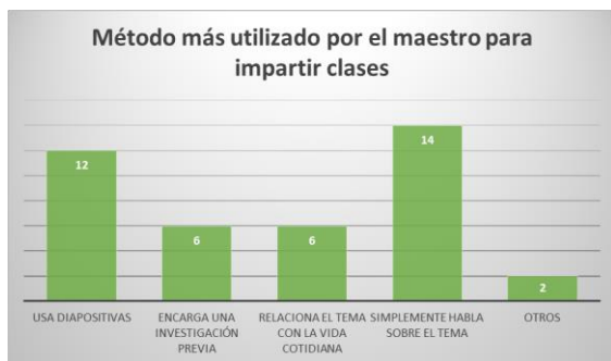
Imagen 6. Con la ayuda de este gráfico pudimos determinar cuán familiarizado está el alumno con el método lúdico.

En base al método tradicional de enseñanza 8 personas que su conocimiento sobre la química es muy bueno, 10 bueno, 13 regular, 6 malo y 3 personas muy malo. El 65% de los profesores nunca hacen uso de material didáctico o juegos para explicar la clase.