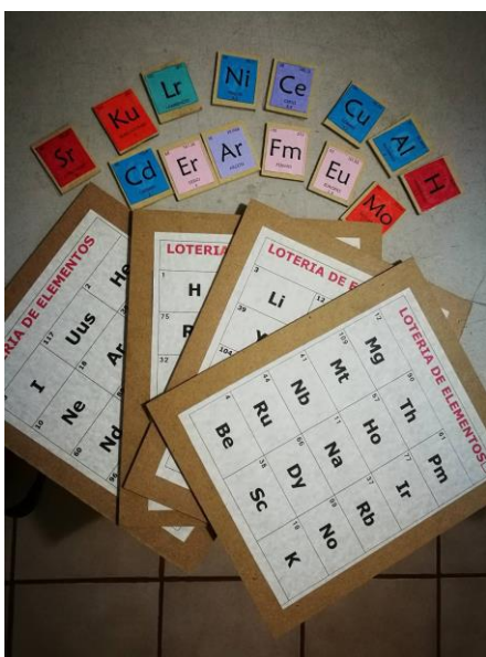
Imagen 2. Lotería de elementos y símbolos de la tabla periódica.

La lotería que se hizo fue sobre la tabla periódica, en las tablas se encontraban los símbolos y en las tarjetas iban los nombres de los elementos. En el juego de serpientes y escaleras el tablero casi no tuvo cambios respecto al original, en este para poder subir una escalera o en todo caso bajar por la serpiente se tenía que resolver un problema relacionado con las leyes de los gases.