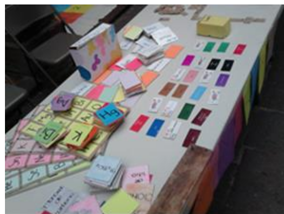
Imagen 4. Material que fue utilizado con los alumnos durante la investigación.

Después llevamos a cabo la implementación de los materiales previamente realizados para observar el comportamiento de los alumnos frente a esta nueva estrategia de enseñanza