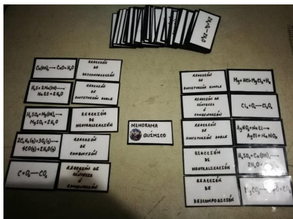
Imagen 1. Memorama de reacciones químicas

La lotería que se hizo fue sobre la tabla periódica, en las tablas se encontraban los símbolos y en las tarjetas iban los nombres de los elementos. En el juego de serpientes y escaleras el tablero casi no tuvo cambios respecto al original, en este para poder subir una escalera o en todo caso bajar por la serpiente se tenía que resolver un problema relacionado con las leyes de los gases.