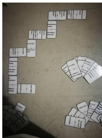
Imagen 3. Domino de reacciones químicas

El adivina quién consistía en identificar las características de cada uno de los hidrocarburos (alcanos, alquenos, alquinos). Por último, el domino al igual que el memorama, tenía que identificar qué tipo de reacción era cada una.