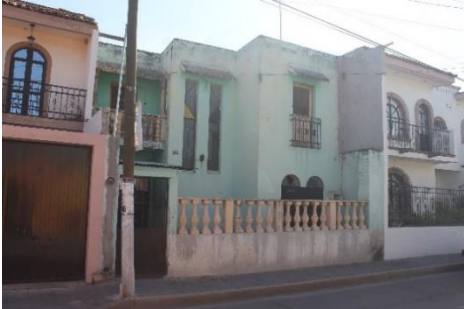
IMAGEN 3. Casa en la calle I. Allende cuyo alineamiento no es 0. Se aprecia una balaustrada en el frente.

Se realizan las calles sobre las que se trabajan las fachadas en la calle Ignacio Allende encontramos casas cuyo alineamiento ha sido modificado, con recubrimientos ajenos a lo tradicional de la región, la instauración de balcones cuya existencia carece de sentido, así como de imitaciones de techos a dos aguas.