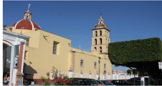
IMAGEN 2. Vista lateral de la Parroquia.

Parroquia de San Juan Bautista: Construido en 1690, de carácter barroco sigue siendo un punto de reunión importante para la población, por su ubicación estratégica y amplio espacio en las inmediaciones.