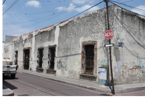
IMAGEN 5. Casona barroca en deterioro. A una cuadra del jardín municipal.