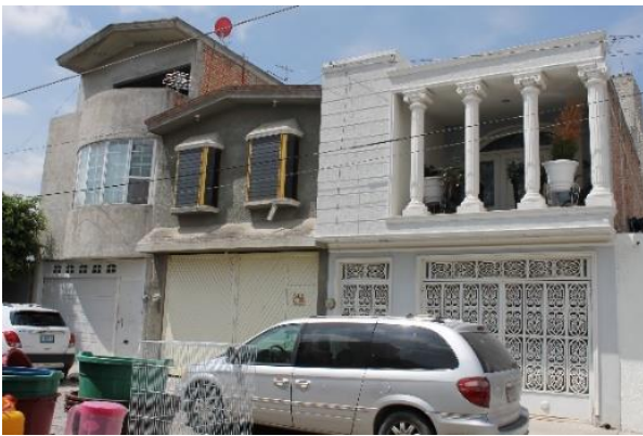
IMAGEN 6. Tres construcciones en el centro no histórico.