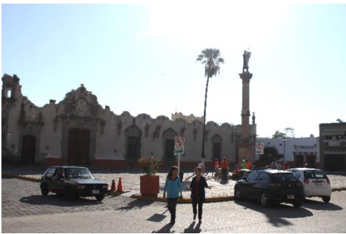
IMAGEN 1. Palacio de Herrera.

-Palacio de Herrera: “También conocido como La Casa del Águila o La Casa de los Perros, construcción colonial del siglo XVIII, realizada en estilo barroco.” [4]