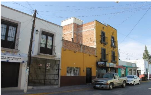
IMAGEN 4. Edificación de 3 pisos en la calle M. Matamoros.

En el extremo opuesto del jardín municipal encontramos la calle Mariano Matamoros, en ella se localizan edificios que rompen con el perfil urbano: Imponentes construcciones de 3 pisos que provocan un choque visual con su presencia. Confrontando ésta ola de construcciones con nuevas tipologías estilísticas, están las casas tradicionales abandonadas: se ha dejado que estas se desgasten hasta derrumbarse, provocando pérdida del patrimonio histórico arquitectónico del municipio; para los propietarios resulta más fácil dejar que se pierda la edificación a restaurarla.