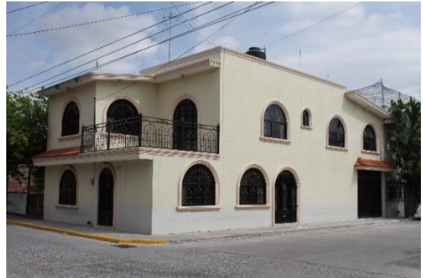
IMAGEN 7. Casa en Villas del Sur.

En contraposición a ambas zonas, se encuentra la colonia Villas del Sur, ubicada aledañosamente a la ex estación del tren. En ella podemos encontrar casas de inspiración californiana: las baywindow abundan a ambos lados de la acera, así como las marquesinas imitando techos a dos o cuatro aguas: ambos elementos son meramente simbólicos, ya que no se ocupan en base a su función original, han sido descontextualizados por los locales.