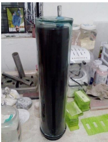
IMAGEN 5: Modelado de la peletizadora en CAD.

tamaño del pelet, tiempo de reacción y presión de compactación.