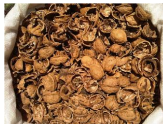
IMAGEN 2: Cáscara de nuez utilizada

Posteriormente, se ingresan en el pirolizador solar durante un día, se queda un orificio destapado a la atmósfera para que el vapor de agua sea retirado. Al día siguiente se tapa dicho orificio y se deja todo el día para evaluar su pirolización (craqueo térmico).