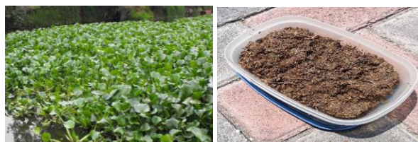
IMAGEN 3: Lirio acuático (a) en la laguna y (b) después de secado y molido.