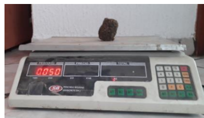
IMAGEN 4: Modelado de la peletizadora en CAD.