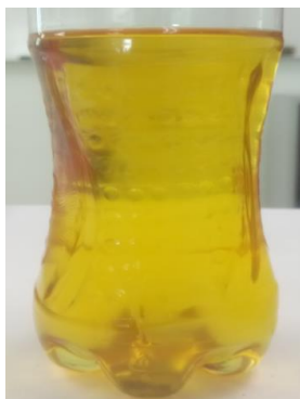
IMAGEN 4: Biodiesel purificado obtenido

En la Imagen 4 se presenta el biodiesel que se obtuvo.