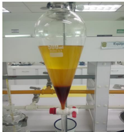
IMAGEN 2: Separación del biodiesel y la glicerina

biodiesel (fase liviana) y la glicerina (fase pesada), se separan colocando la mezcla en un embudo de decantación, como se muestra en la Imagen 2.