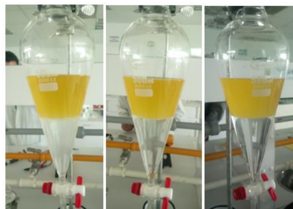
a) Primer lavado b) Segundo lavado c) Tercer lavado

Agregando agua destilada en un volumen igual a un tercio del volumen de biodiesel, se agitó y se dejó de nuevo en el embudo de decantación hasta que las fases se separaran, para después eliminar la fase acuosa. El proceso se repitió hasta alcanzar un valor de pH del agua de lavado aproximadamente neutro. En la Imagen 3 se muestran los tres lavados realizados.