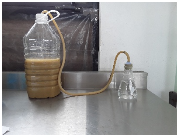
IMAGEN 2: Fermentación de la cascara ya pretratada