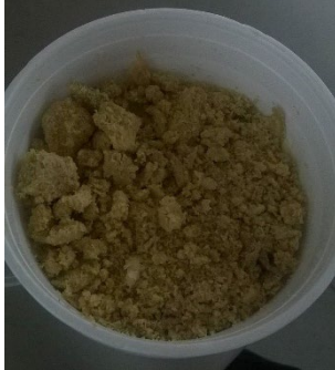
IMAGEN 1: Cascara triturada