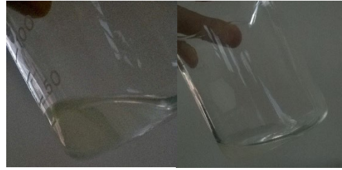
IMAGEN 4: Liquido incoloro