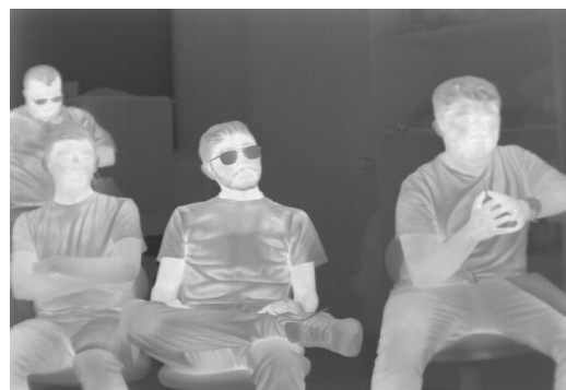
Imagen 1: Fotografía tomada con la cámara térmica.