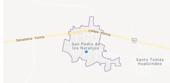
Figura 1.- Ubicación geográfica de San Pedro de los Naranjos

San Pedro de los Naranjos se encuentra a seis kilómetros al poniente de la ciudad de Salvatierra sobre la carretera que va a Yuriria. Según el censo de población de INEGI en el 2010, San Pedro de los Naranjos cuenta con una población total de 4,494 habitantes, de los cuales 2,304 son mujeres y 2,190 hombres.