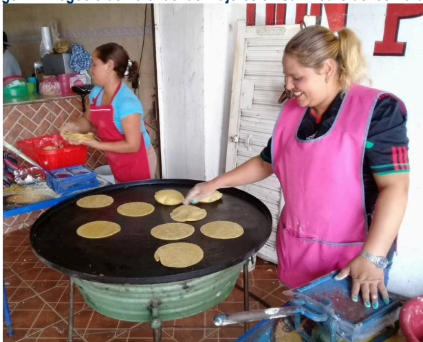
Imagen 1.- Negocio de Tortillas de mujeres en San Pedro de los Naranjos