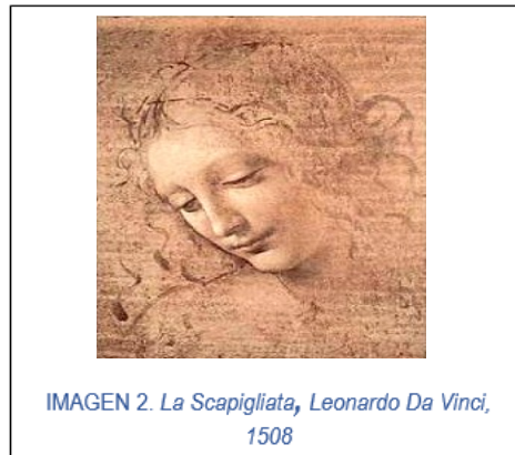
IMAGEN 2. La Scapigliata , Leonardo Da Vinci, 1508