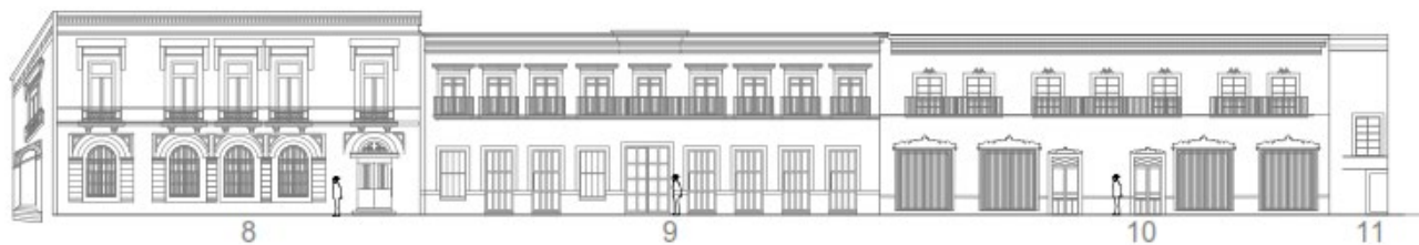
IMAGEN 4 Fachada NOROESTE dibujo obtenido de Auto-Cad.

Así pues, las siguientes líneas hablan de la última fachada que compone el Jardín Unión, ubicada en la dirección noroeste, muy parecida en estilo a la anterior; los usos de los edificios en esta son clasificados como mixtos, de servicios y comercial, donde el ámbito habitacional también está presente.