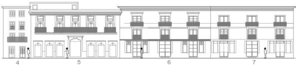
IMAGEN 3 Fachada sureste, representación en Auto-CAD.

El tercer y último edificio corresponde al Hotel San Diego y restaurante Tasca de la Paz, clasificado como un edificio de servicios. En este se distingue un lenguaje más moderno, ya que los niveles de sus vanos y cuerpos coinciden de manera lineal, además de estructurarse con cuatro niveles y cuatro cuerpos, en el segundo nivel, el balcón que acompaña a los vanos es continuo mientras que en el resto de los superiores es individual; la estructura es de muros de carga y cubiertas planas de concreto armado.