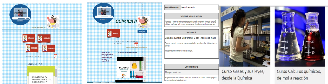
Figura 1. Diseño de herramientas virtuales para el apoyo didáctico de la asignatura de Química II. A) Interfaz de Aula virtual Química II, en la página http://www.ciencialineando.com construida en www.wix.mx B) Interfaz de los microcursos, publicados en https://nodo.ugto.mx/catalogo/cursos-de-nivel-medio-superior .

La evaluación cualitativa se llevó a cabo a través de un análisis de las respuestas obtenidas de las encuestas, entrevistas y resultados de las evaluaciones tanto en la página web como en los microcursos, el tipo de muestreo fue no probabilístico por conveniencia, la muestra estuvo constituida por 120 estudiantes. La evaluación cuantitativa se realizó a partir de los resultados obtenidos de las evaluaciones sumativas del desempeño y recuperación de aprendizajes de los estudiantes antes y después de la aplicación de la estrategia, a través de formularios Google, concentrados en una tabla de Excel. Para el manejo y análisis de los datos se realizó con el paquete estadístico SPSS (Versión 15.0), aplicando la estadística descriptiva, identificando frecuencias y porcentajes; e inferencial al aplicar la correlación de Pearson para identificar el comportamiento de las variables de estudio. Para evaluar la página como herramienta, se programó un cuestionario aplicado a los estudiantes.