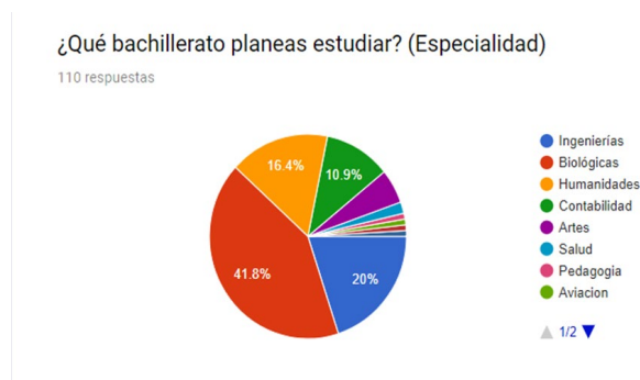
Imagen 1: Especialidades del bachillerato elegidas.

En la gráfica siguiente podemos apreciar como la mayoría de los jóvenes han seleccionado como especialidad el área de ciencias biológicas y, de éstos, la mayor parte se decidió por medicina; en segundo lugar, está el área de humanidades, la cual en su mayoría fue seleccionada por mujeres; en tercer lugar está la especialidad de ingenierías.