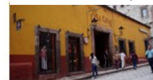
IMAGEN 5.-Casa Canal