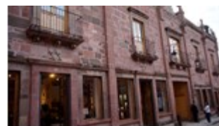
IMAGEN 1.- Dôce18