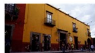
IMAGEN 3.-Plaza Principal