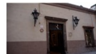
IMAGEN 4.- Casa Conceptstore