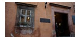
IMAGEN 6.- Plaza Atrio