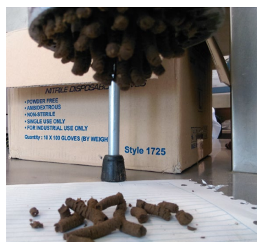
IMAGEN 1: Foto de la obtención de pellets.

En las pruebas químicas los valores más altos fueron el carbón con 1.8 ppm y el cadmio con 1.73 ppm, mientras que el plomo y el fosfato no se hicieron presentes.