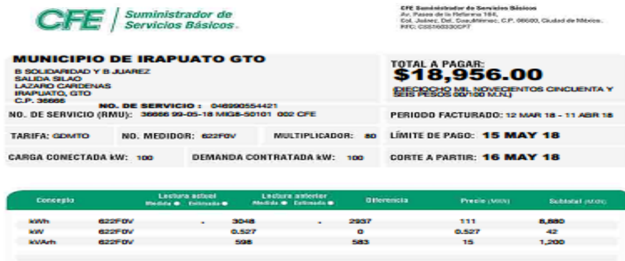
Imagen 3 Facturación mes de abril 2018 por CFE (Dirección de Medio Ambiente)