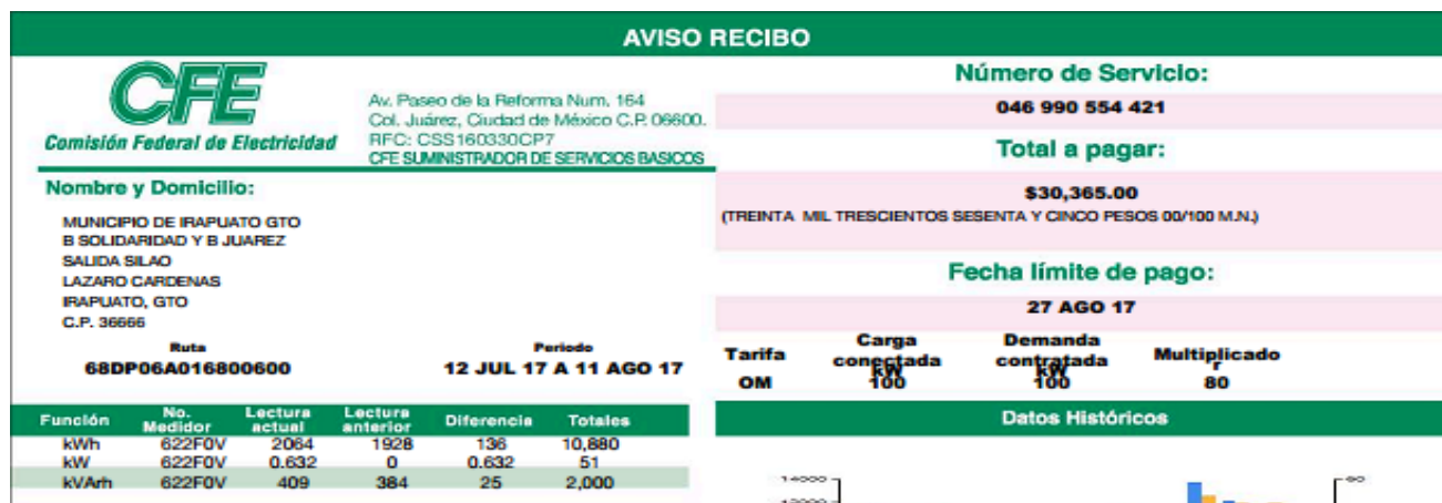
Imagen 1 Facturación del mes de agosto 2017 por CFE (Dirección de Medio Ambiente)

Con los datos obtenidos, se estimó un consumo de energía eléctrica de 57.86 kWh por día. A partir de la adquisición de datos históricos de facturación de energía eléctrica de la oficina, se comparó el cálculo de consumo inventariado en el presente estudio con el consumo facturado dentro de un periodo similar de tiempo, un año anterior. Se sabe que no se han presentado modificaciones dentro de las oficinas en este año, por lo cual el consumo de energía calculado debe ser muy cercano al facturado. La lectura facturada indica una demanda de energía de 51 kW con un consumo de $30,365.00, a una tarifa GDMTO (antes conocida como O-M) [4].