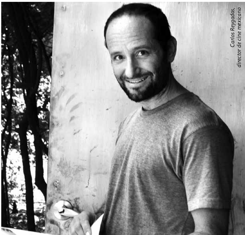
Carlos Reygadas, director de cine mexicano

TAQUILLA: general, $30.00; comunidad universitaria e INAPAM, $20.00 Cupo limitado / No se permite el acceso una vez iniciada la función /