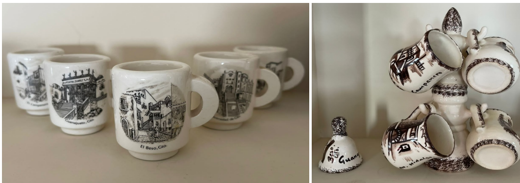
Imagen 6. Cerámica tradicional de San Luisito. Vemos los jarritos y tacitas que se hacía. En la imagen se puede apreciar la diferencia de calidad en el dibujo de las imágenes.

La más famosa de las cerámicas son piezas gruesas de color blanco y con imágenes pintadas en color sepia. Estas piezas se vendieron con pequeñas escenas de paisajes famosos de Guanajuato, como el Callejón del beso, el Baratillo, las escalinatas de la Universidad, el Teatro Juárez, etc. Y se hacía tazas, tarros, jarros, platos, etc. Pero también piezas pequeñas como de juguete y campanitas. Desafortunadamente los artesanos ya no están pintando con la calidad de antes, aunque traten de seguir con la misma idea. Las piezas son de precios muy accesible.