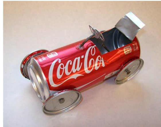
Imagen 1 Carritos hechos con latas de sardinas. Imagen 2. Lata de refresco hecho carrito.