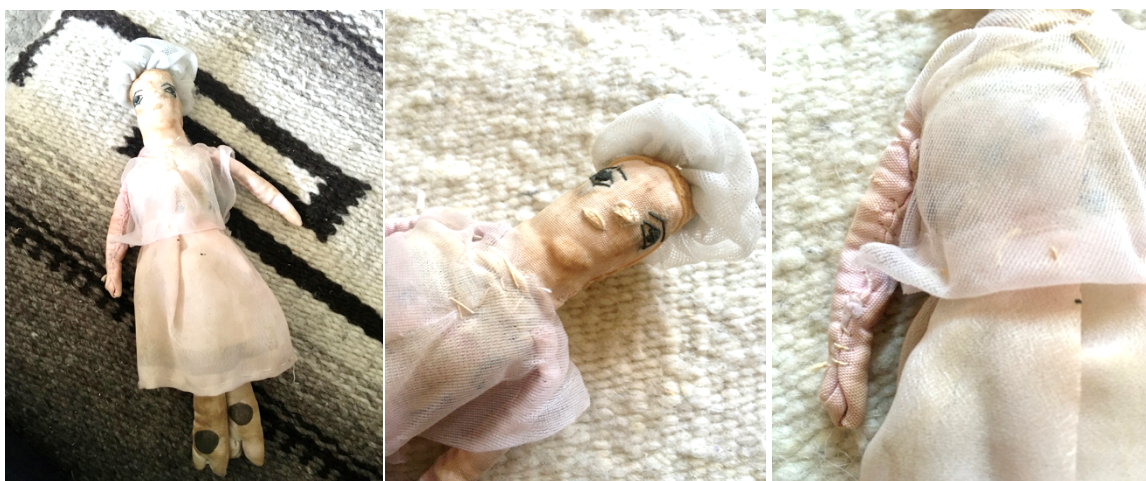
Imagen 10. Muñequita de trapo de la Maestra Georgina Romo. Elaborad con diferentes tipos de telas y retocada de forma manual.