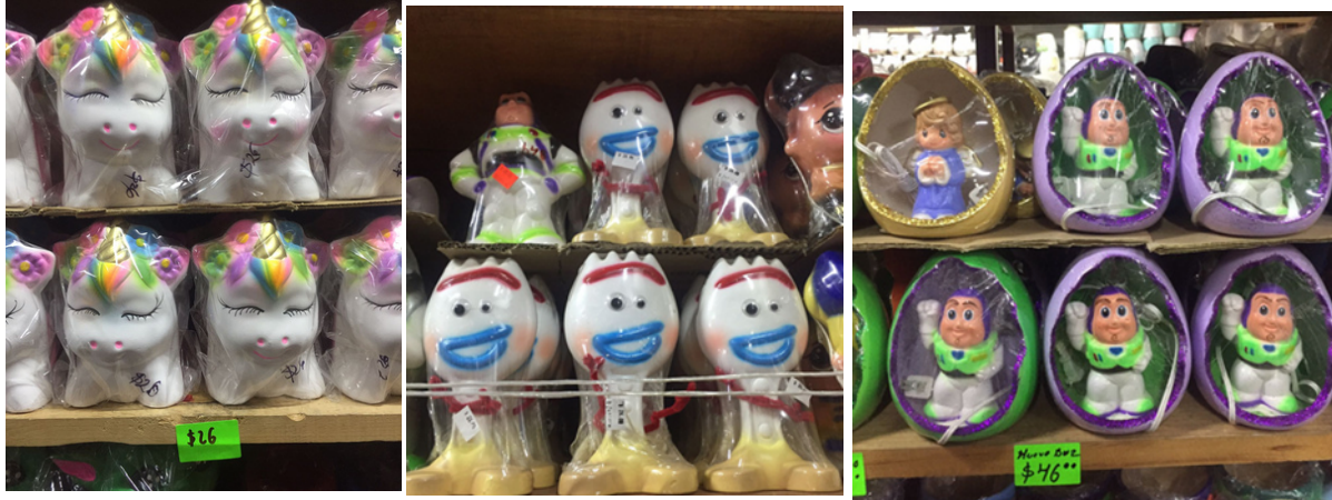
Imagen 8. Cerámica en tienda "Cerámica y decoración Deborah" en el barrio de San Clemente. Productos enfocados al consumo de los niños. Alcancías y lámparas de unicornio, alcancía de Forky y Buzz Lightyear.

En este mismo taller se hacen cazuelitas y ollitas de juguetes, que anteriormente se moldeaban y se secaban al sol, se engretaban para darle brillo y se metían al horno. La nueva realidad de la cerámica "tradicional" es que con el tiempo va adquiriendo las nuevas modas, y en este sentido, como lo hemos mencionando, las formas que se adaptan pueden ser cursis, baratas y de alto consumo.