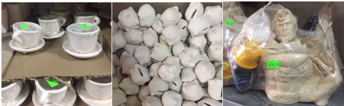
Imagen 9. Cerámica Don Max, Juego de taza y plato por $10 pesos. Alcancías miniaturas, y figuras de personajes de películas, super héroes y princesas que incluyen su pintura acrílica que pueden llegar a costar $50 pesos.

En estos talleres de cerámica también realizan cerámica a medio terminar, a manera de moldes, para manualidades, muchas veces dirigido a la temática para niños, para que ellos mismos hagan su manualidad y juguete.