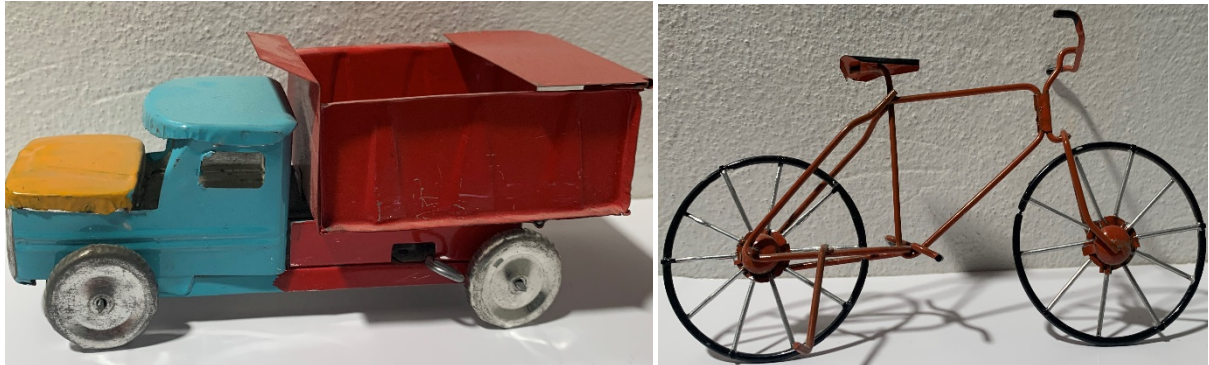
Imagen 4. Camioncito de lata, con ruedas de tapas. Bicicleta de alambre. Las dos piezas terminadas con pinturas de aceite de colores.

Debemos comentar que esta técnica puede ser que tenga acabados muy burdos, que hace en cierta forma, complicado que los niños jueguen con estos, pues a veces los cortes de la lámina pueden cortar la piel, y si no está bien tratada, como cualquier metal al mojarse, se oxida.