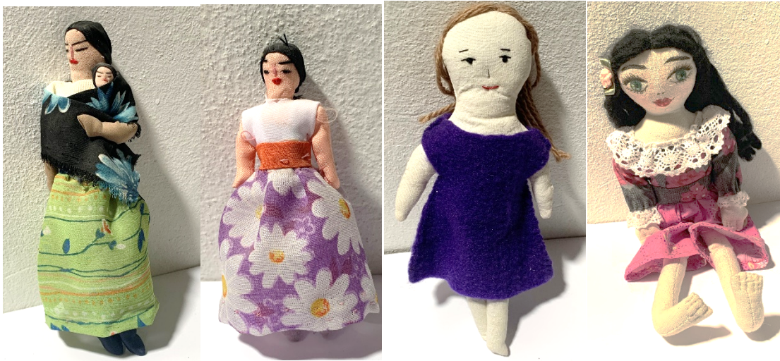
Imagen 11. Imagenes 11 a y b, Muñequitas de trapo tradicional de Guanajuato, se vende en Mercado Hidalgo. 11.c y d. Son muñequitas de trapo de diseñador. Ya no se venden como artesanía sino en tiendas de diseño como el Corazón Parlante, en Guanajuato.

Es importante mencionar que además de ser sumamente creativa la forma de resolver este juguete de muñecos de trapo, no solo de mujercita, sino hay de muchos tipos, la técnica de muñeca de trapo se ha retomado en los últimos años para hacer propuestas de muñecas de diseño, que más que sea de juguete para niña se han convertido en muñeca de colección. En Guanajuato, al igual que se si que encontrando la tradicional muñeca de trapo en el Mercado Hidalgo, podemos ver en las tiendas de diseño, como el Corazón Parlante, la venta de muñecos de trapo hecho por diversos diseñadores y artistas. Obviamente ahora este juguete ya no es tan económico ni accesible para las clases populares, lo que si es que han logrado revalorar este tipo de propuesta y rescatar las técnicas tradicionales.