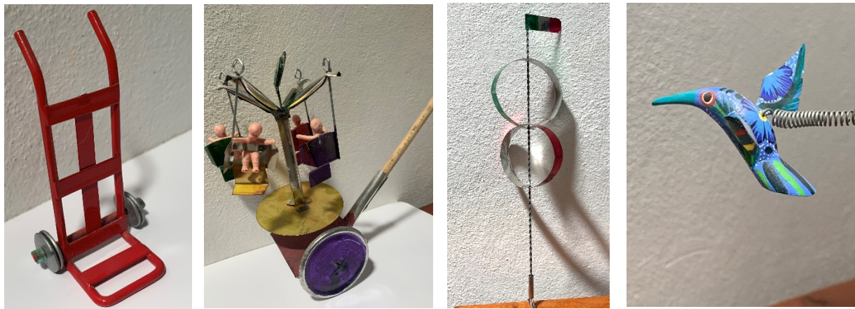
Imagen 5. Diablito de carga con ruedas de rondanas, sillas voladoras que al girar se mueven, aros de metal giratorios y con un sistema similar colibrí, tipo alebrije, que corre por un alambre que ofrece resistencia y se mueve como colibrí, esta versión es de Oaxaca. Por el conector del resorte.