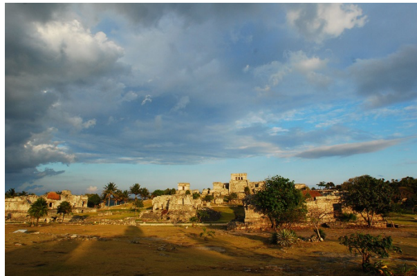
Ilustración 2 de Chichén Itzá. (Instituto Nacional de Antropología e Historia, 2022)

El área abierta a la visita pública tiene una extensión de 264 ha, donde se concentran los principales complejos de edificios monumentales como La Ciudadela y el Templo de la Serpiente Emplumada, la Calzada de los Muertos y los conjuntos residenciales que la flanquean, las Pirámides del Sol y la Luna, el Palacio de Quetzalpapálotl y cuatro conjuntos departamentales con importantes ejemplos de pintura mural como son Tetitla, Atetelco, Tepantitla y La Ventilla, además de otros dos conjuntos de corte habitacional denominados Yahualá y Zacuala. Se ubica en el Estado de México aproximadamente a 40 kilómetros al noreste de la Ciudad de México.