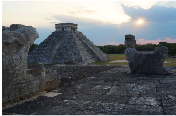
Ilustración 3 de Chichén Itzá.

Chichén Itzá es el mejor ejemplo de los movimientos migratorios que se dieron en Mesoamérica hacia el Posclásico Temprano, ya que reúne rasgos de cultura material tanto del área Maya como del centro de México, particularmente de filiación Tolteca. Además, Chichén Itzá fue capital de un amplio territorio en la península de Yucatán, encabezado por la liga de Mayapán, del 987 hasta el año 1200 d. C