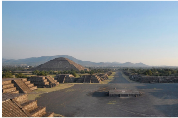
Ilustración 1 Zona Arqueológica Teotihuacán (Instituto Nacional de Antropología e Historia, 2022)

El área abierta a la visita pública tiene una extensión de 264 ha, donde se concentran los principales complejos de edificios monumentales como La Ciudadela y el Templo de la Serpiente Emplumada, la Calzada de los Muertos y los conjuntos residenciales que la flanquean, las Pirámides del Sol y la Luna, el Palacio de Quetzalpapálotl y cuatro conjuntos departamentales con importantes ejemplos de pintura mural como son Tetitla, Atetelco, Tepantitla y La Ventilla, además de otros dos conjuntos de corte habitacional denominados Yahualá y Zacuala. Se ubica en el Estado de México aproximadamente a 40 kilómetros al noreste de la Ciudad de México.