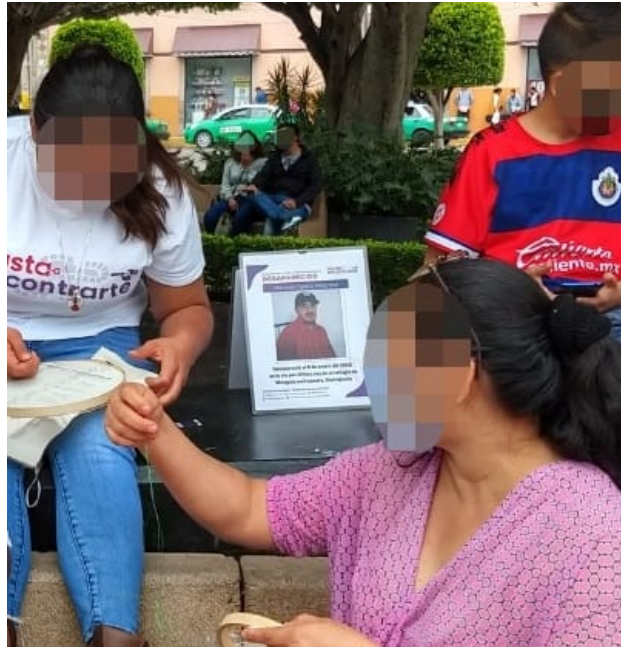
Figura 4. Gafete de integrante del colectivo Hasta encontrarte, originario de Irapuato.