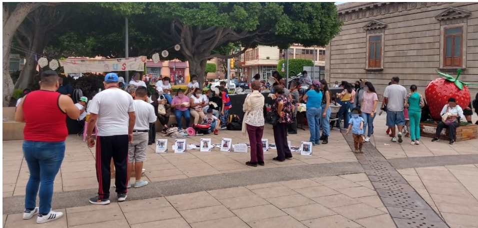
Figura 5. Fotografía del taller de bordado con asistentes del colectivo Hasta encontrarte en Jardín Irapuato.

En cuanto a la retroalimentación que se recibe en los distintos espacios por parte de las personas externas a los colectivos, fue perceptible que la sensibilización y participación política es diversa. Por lo regular, hay miradas, lo que implica el comienzo de un proceso de sensibilización de lo que los colectivos proponen como algo que debería ser una preocupación social. Otras expresiones del interés se dieron por personas que iban pasando y fueron también haciendo conversación entre ellos alrededor del espacio del taller y frente a las lonas, un par de personas periodistas interesadas en hacer contacto con las organizadoras de los talleres, personas tomando fotos y preguntando a las talleristas la justificación de este.