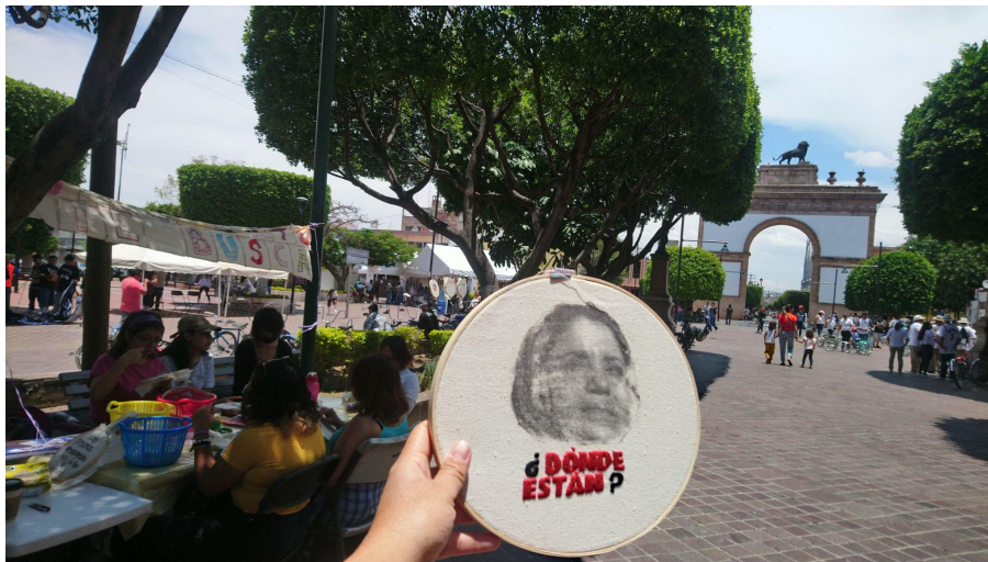
Figura 6. Fotografía en la Calzada de León, Guanajuato, de una pieza elaborada durante el taller de bordado.

"Las participantes con quienes tuve más interacción durante el taller platicaban moderadamente sobre sus desaparecidos, parece que estos momentos de bordado y convivencia con sus compañeras del colectivo representan para ellas un espacio seguro en dónde hablar de otras cosas de la vida mientras hilvanan y recuerdan. Si bien, el bordado el cual elaboran gira en torno a sus familiares desaparecidos, sus preocupaciones de quehacer cotidiano y el mismo entorno público entran en juego a la conversación" (Diario de campo, julio 2022).