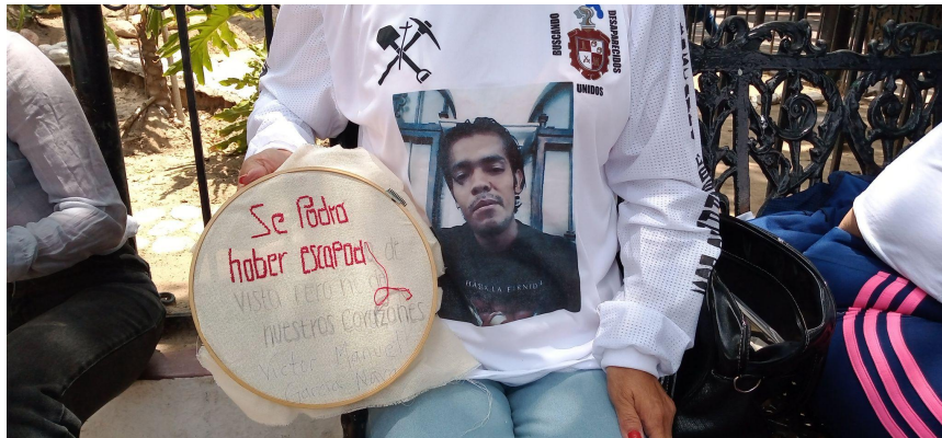
Figura 2. Fotografía de playera y bordado de una integrante del colectivo Unidos Buscando Desaparecidos Salamanca. Fuente: Trabajo de campo del equipo de investigación, julio 2022.

Son objetos fáciles de portar en cualquier momento, y que son puestos en lugares visibles: en Salamanca, las mujeres mandan hacer playeras para cada una de las integrantes que lo quieran (todas las que estuvieron presentes en el taller tenían una o estaban en espera de recibirla), y las diseñan de manera que en la parte frontal del torso se muestre una fotografía de la persona desaparecida (elegida por las mismas mujeres); en Irapuato, las mujeres tenían lonas pequeñas, de alrededor de 30 centímetros de largo, y hojas plastificadas de tamaño carta que portaban como gafetes en el pecho, y ambos objetos contenían una ficha de desaparición con todos los datos personales de la persona a la que buscaban.