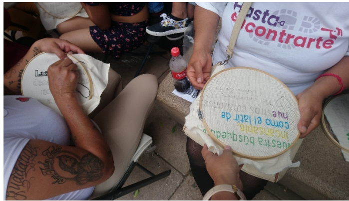
Figura 1. Fotografía de los bordados que elaboran integrantes del colectivo Hasta Encontrarte.

En el caso del trabajo de campo, pudimos presenciar, entre otros aspectos, la dimensión afectiva con la que ya contaba en sí misma la acción de bordar, por ejemplo, mujeres que bordan desde antes de casarse o después de casarse, esto formando parte de su historia personal. Esto sumado a la experiencia previa del bordado en grupo (en anteriores talleres); además del contenido emocional emergente a partir del recuerdo de su familiar, la persona o personas que buscaban. Olalde también menciona los bordados como una expresión de la “fuerza del alma” que surge como búsqueda de la verdad en torno a la persona desaparecida. (Olalde, 2022). Se potencia así el contenido emocional, pero además agregando una meta común dentro del grupo: encontrarles a todos/as; lo que facilita la comunicación y deja fluir la actividad de bordar su propio lienzo y de compartir verbalmente con las demás participantes. En el espacio con las buscadoras como parte del taller, pudimos percibir un ambiente armónico y seguro, pero a la vez empático y de respeto. La manera en la que las buscadoras nos compartían un poco de su historia y hasta de aquello que las llamaba a participar en el colectivo, nos dejaron ver que esta actividad de bordado les permitía abrir un momento íntimo con ellas mismas y con el grupo, una actividad con objetivo, pero digerible y que apoyaba a la cimentación de una red de apoyo más.