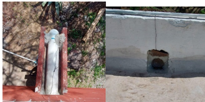
Figura 6. Instalación del sistema de conducción y uso de una canaleta de la superficie de captación.

Continuando con la instalación del captador de agua de lluvia, se conectó el captador de agua de lluvia desde la azotea de salón 513, el cual se encuentra en la parte superior de la escuela. Este lugar fue elegido considerando que se puede obtener una gran cantidad de agua de lluvia captada debido a que es una zona alta y despejada. Para la captación del agua se utilizó una de las canaletas de la azotea (Figura 6), se aseguraron los tubos con un poco de cemento para evitar movimientos que podrían causar daño al captador o contaminación del agua.