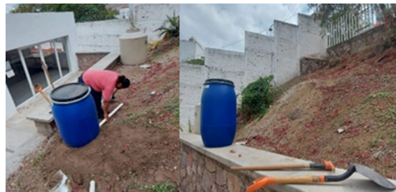
Figura 3. Aplanado de la superficie de recolección de agua.

1.- Aplanado del suelo: Se aplanó el suelo debido a que existía un desnivel el cual no favorecía la colocación del recolector de agua tanto de primeras lluvias como de almacenamiento. En la Figura 3 se observa la zona del suelo que se aplanó para colocar el SCALL.