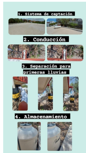
Figura 2. Partes de un Sistema de Captación de Agua de Lluvia implementado en la ENMSGTO.