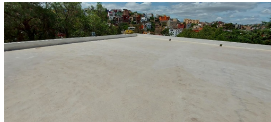
Figura 4. Superficie de recolección de agua.

2.- Limpieza de la superficie de captación de agua de lluvia: Se limpió la superficie de recolección del agua de lluvia de sólidos como hojas, piedras y polvo, para que no tapen las canaletas y contaminen el agua almacenada, En la Figura 4 se observa la superficie una vez finalizada su limpieza.