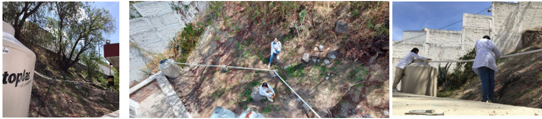
Figura 8. Sistema de conducción de agua de lluvia del captador de primeras lluvias al tanque de almacenamiento.

Cabe destacar que durante la temporada de lluvias en que se realizó el trabajo, el verano de 2022, se tuvo un evento pluvial después de haber sido instalado el SCALL, lo cual permitió hacer uso del mismo. En esa ocasión se recuperó una cantidad de 845 litros de agua de lluvia (Figura 9), la cual es equivalente a 42 cubetas de 20 litros que pueden ser usadas para limpiar las instalaciones, o 211 descargas en los inodoros instalados en la escuela, los cuales utilizan 4 litros por descarga.