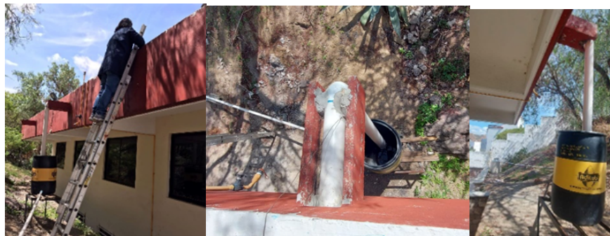
Figura 7. Sistema de conducción de agua de lluvia de la superficie de captación al captador de primeras lluvias.

3.- Instalación del sistema de conducción del agua captada: Se realizó la instalación del sistema de conducción del agua captada entre la superficie de captación y el captador de primeras lluvias (Figura 7) y posteriormente entre el captador de primeras lluvias y el tanque de almacenamiento (Figura 8).