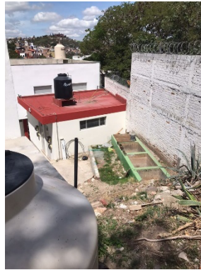
Figura 10. Instalaciones contiguas al SCALL donde se puede utilizar el agua de lluvia captada durante la temporada de lluvias.