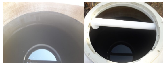
Figura 9. Agua de lluvia captada en un evento pluvial durante la temporada de lluvias del Verano de 2022.

Cabe destacar que durante la temporada de lluvias en que se realizó el trabajo, el verano de 2022, se tuvo un evento pluvial después de haber sido instalado el SCALL, lo cual permitió hacer uso del mismo. En esa ocasión se recuperó una cantidad de 845 litros de agua de lluvia (Figura 9), la cual es equivalente a 42 cubetas de 20 litros que pueden ser usadas para limpiar las instalaciones, o 211 descargas en los inodoros instalados en la escuela, los cuales utilizan 4 litros por descarga.