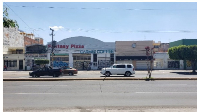
Imagen 05: ([Elaboración propia, locales abandonados o en renta en Celaya], 2023)

Como podemos analizar y comprender, la arquitectura y el urbanismo, no son solo espacios físicos que se pueden construir o demoler, sino que representan en conjunto, aspectos sociales, económicos, vivenciales, políticos, culturales, identitarios, cotidianos, patrimoniales y de muchísima importancia que en general al verse tan afectados por la delincuencia, convierten a una ciudad en un espacio nada sano ni bueno para vivir, y a su gente los vuelve parte del problema aunque en ocasiones no sea así, el paisaje que se genera a través de la arquitectura y el urbanismo son la representación de miles de vidas que día con día siguen construyendo sus historias, y la única manera de realmente conocerlos es viviéndolos, por lo que, que más les podría contar a las personas que todos los días a cada momento, viven en carne propia las implicaciones de las afectaciones de la delincuencia en todos los aspectos de su vida y no solo en lo poco que yo les puedo contar en este escrito.