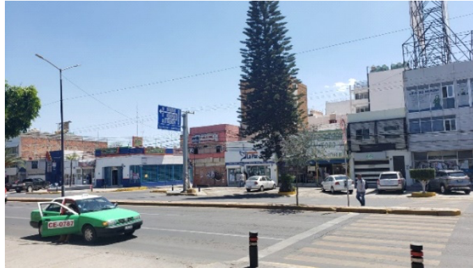
Imagen 04: ([Elaboración propia, locales abandonados o en renta en Celaya], 2023)

En las siguientes imágenes podemos ver como el abandono de locales y viviendas en muchos tramos del bulevar Adolfo López Mateos en la zona centro de Celaya es cada vez más notorio y daña muchísimo el paisaje urbano-arquitectónico. (ver imágenes 04-05)