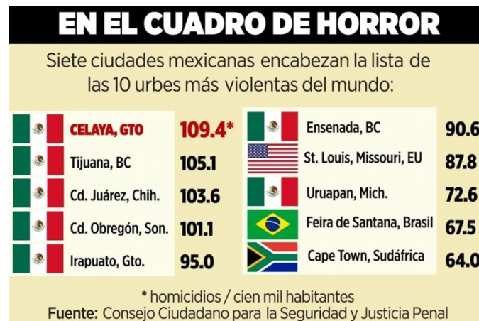
Imagen 2: ([Reforma, estadística de las ciudades más violentas del mundo], 2023)

Con lo anterior no se plantea que la normalización de estos actos antisociales sea buena, porque la violencia y la inseguridad social no son normales, ni tampoco son buenas, esto no hace más que limitar a la comunidad, vulnerarla y crear un ambiente no apto para el buen desarrollo de la ciudad. Sin embargo, como ya se mencionó es lo que nos ha permitido seguir viviendo relativamente bien, dentro de lo que cabe a pesar de las condiciones tan difíciles actuales, a su vez, este aspecto del desarrollo no debe ser el único que se tome en cuenta, puesto que este puede ser medido con muchos otros más factores.