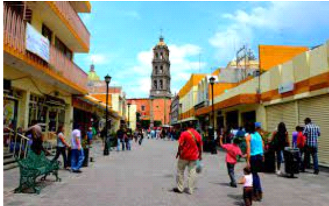
Imagen 1: ([José González, vida cotidiana en Celaya], 2023)

Los habitantes de una ciudad construimos lo social a través de nuestras acciones y actividades diarias ya sea desde una perspectiva activa como por ejemplo protestas o proyectos colectivos, o desde una manera más pasiva o tranquila como tu manera de ser diaria, tus gustos o acciones que contagias a los demás, pero ya sea grande o pequeña, todos hacemos aportaciones al desarrollo social colectivo en una ciudad como en el caso de Celaya y su gente, (ver imagen 1)